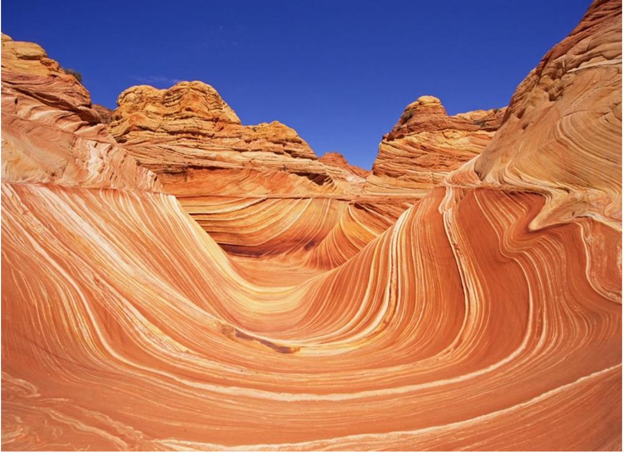
Visitare le Coyote Buttes, nel Parco Vermilion Cliffs National Monument, in Colorado