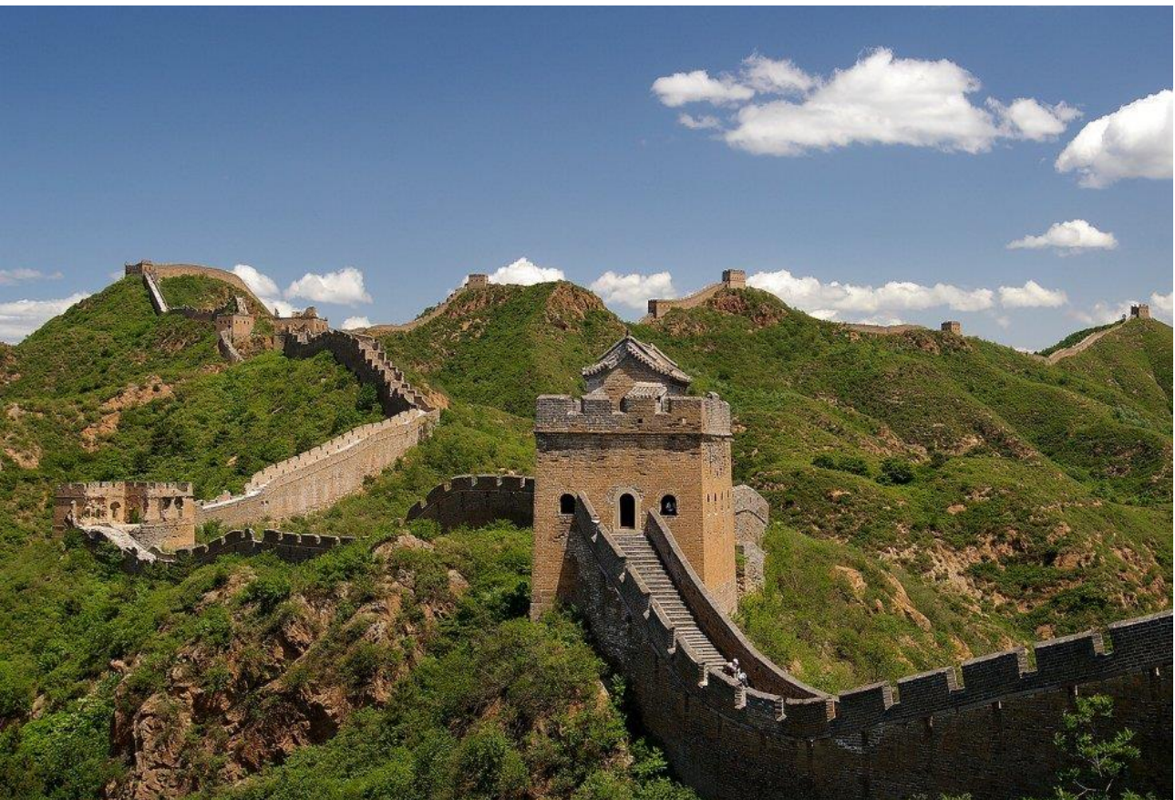
Camminare sulla Grande Muraglia in Cina