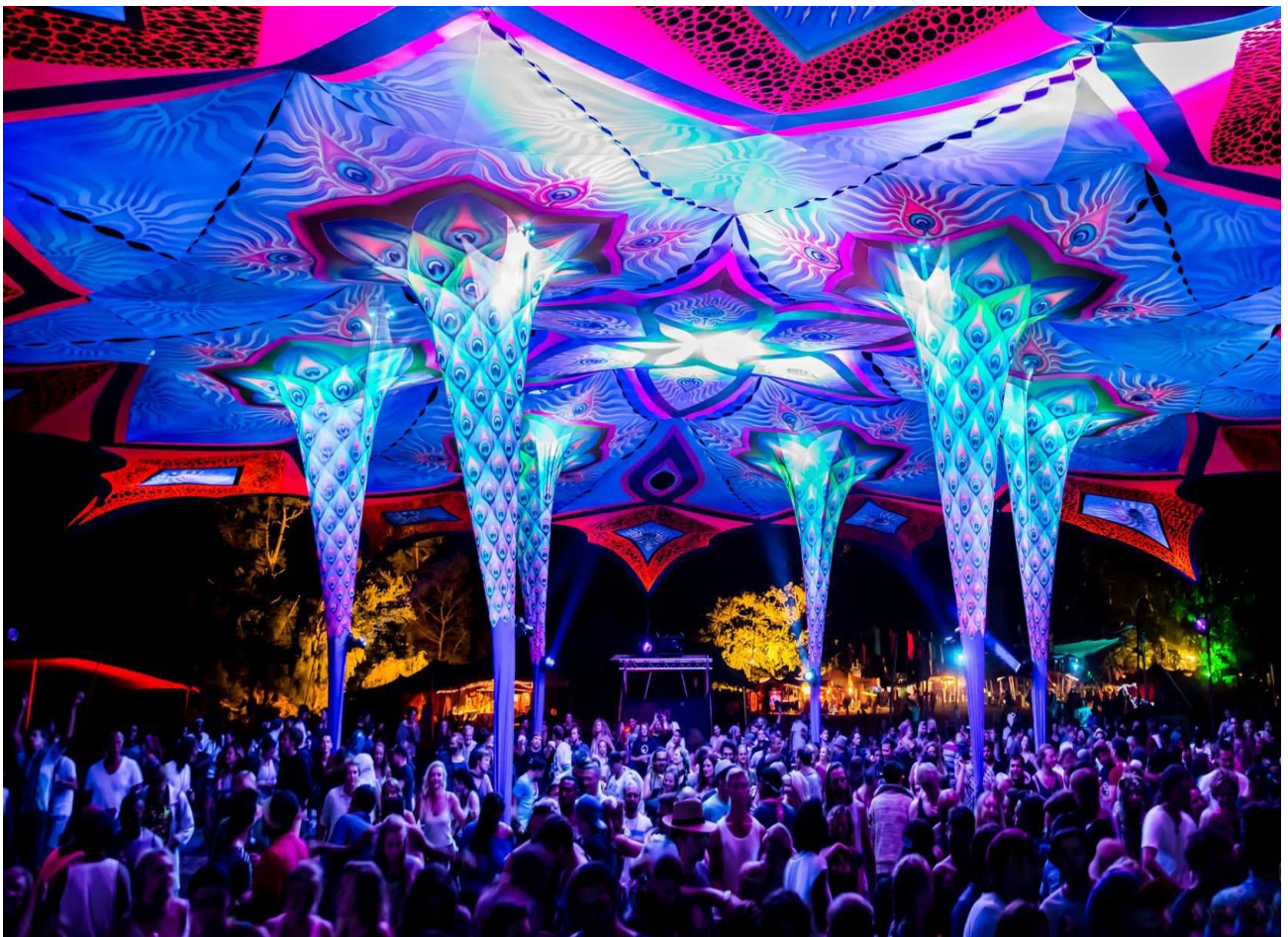
Ballare tutta la notte all'Origin Festival Psy Trance in Sud Africa