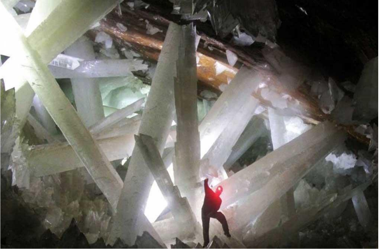
Visitare la grotta dei cristalli giganti a Naica, in Messico