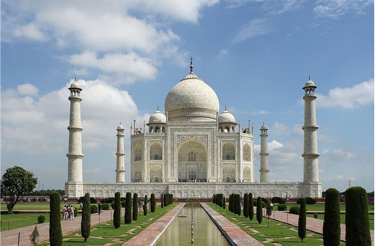
Visitare il Taj Mahal, il “tempio dell’amore”, ad Agra, in India