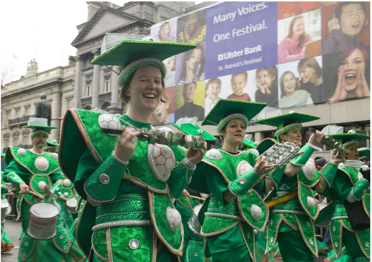
Partecipare alla sfilata del St Patrick's Day a Dublino, in Irlanda