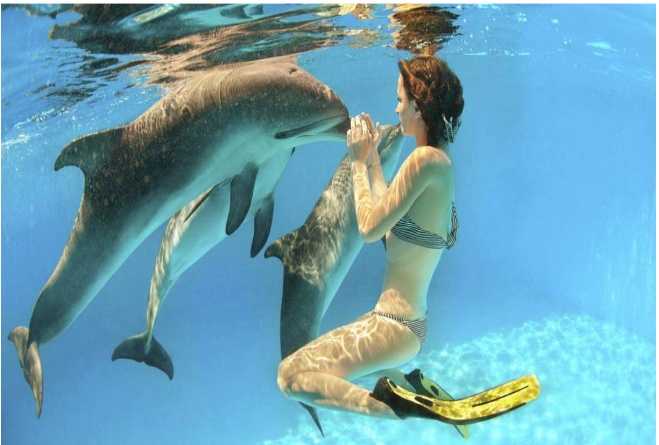
Fare il bagno con i delfini alle Isole Bahamas