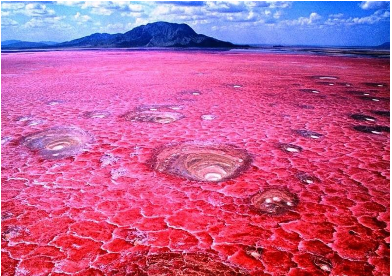
Visitare l'impressionante lago rosso di Natron, in Tanzania