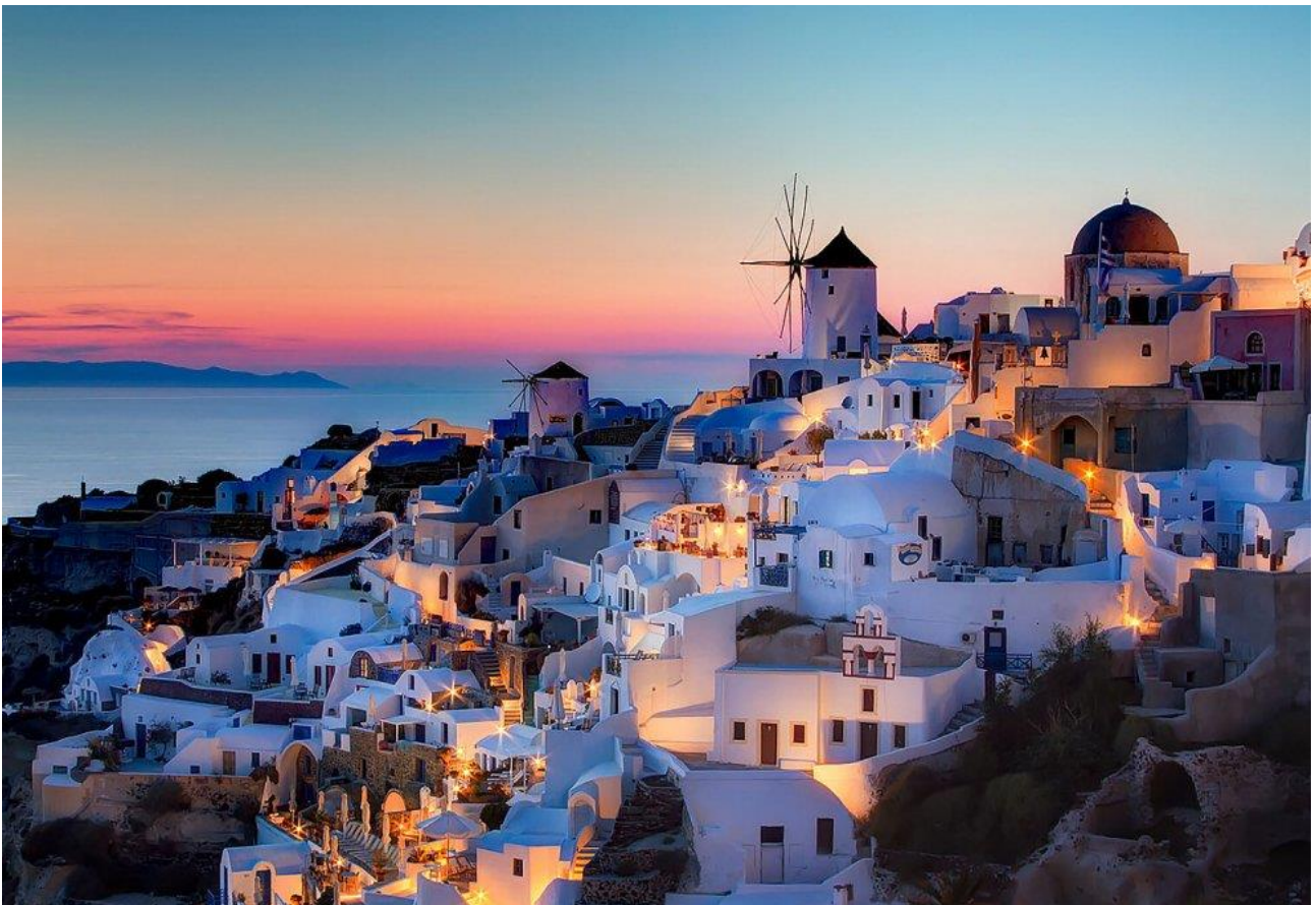
Ammirare il tramonto sul Mar Mediterraneo dall'isola greca di Santorini