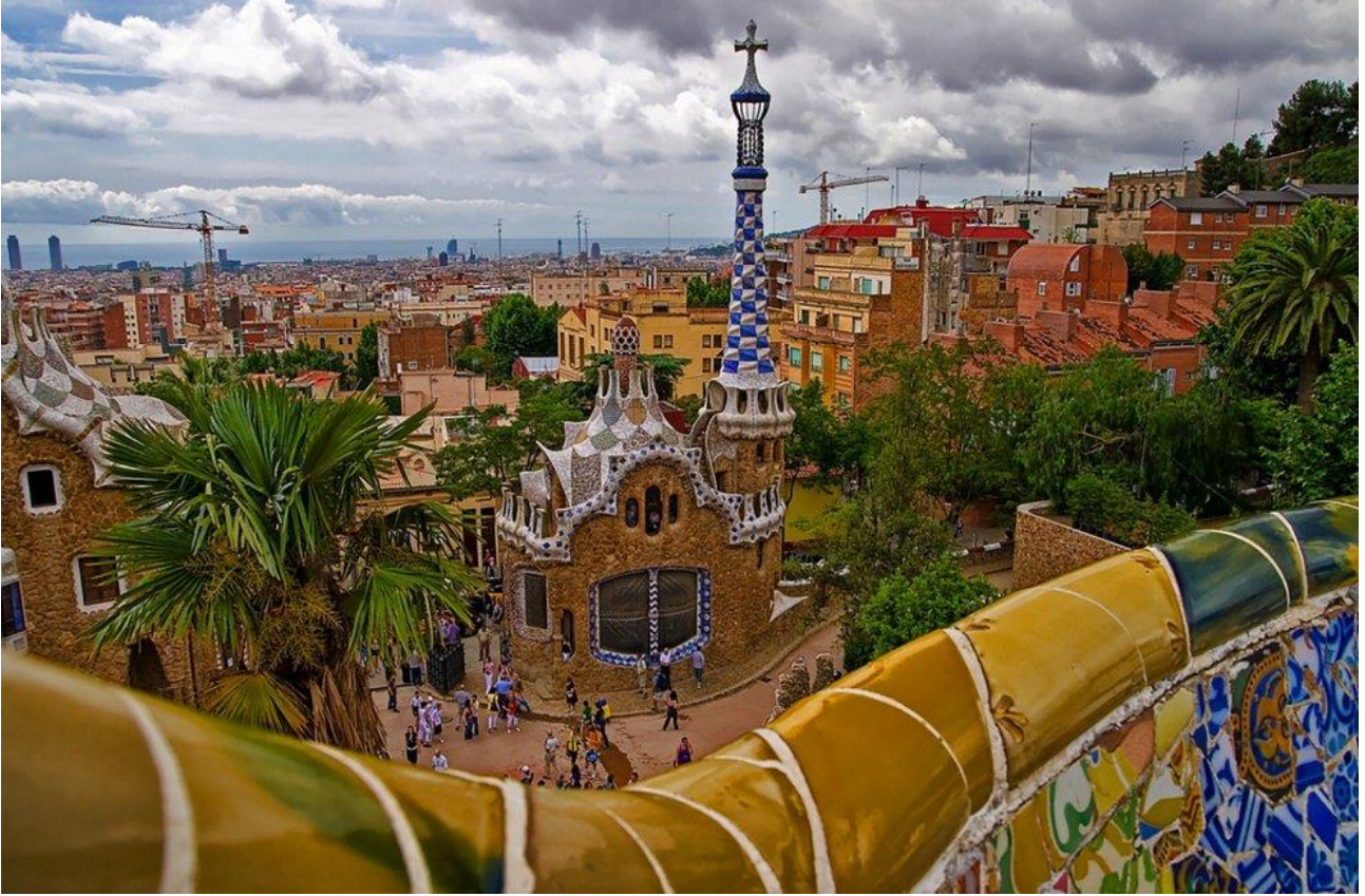
Passeggiare tra le opere di Gaudí al Park Güell di Barcellona