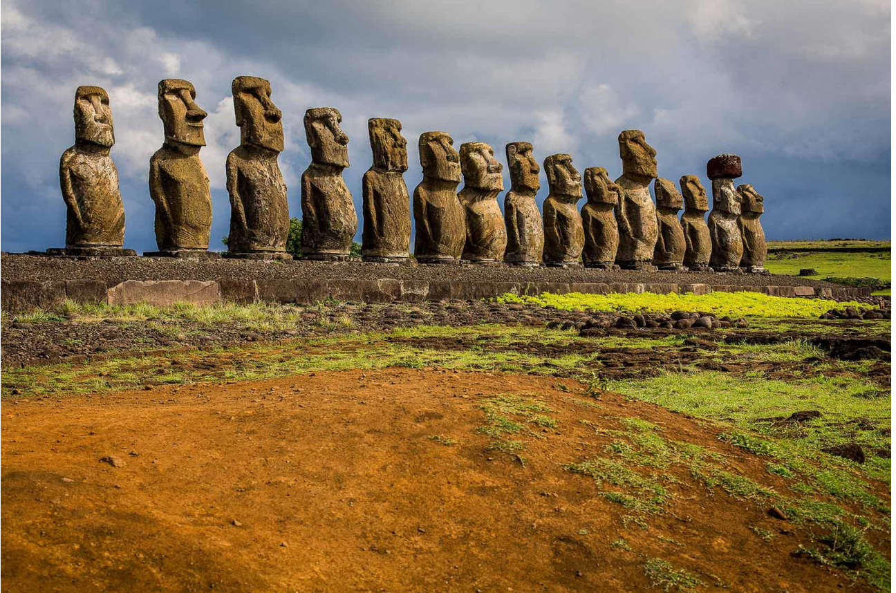
Stare di fronte ai Moai dell'Isola di Pasqua