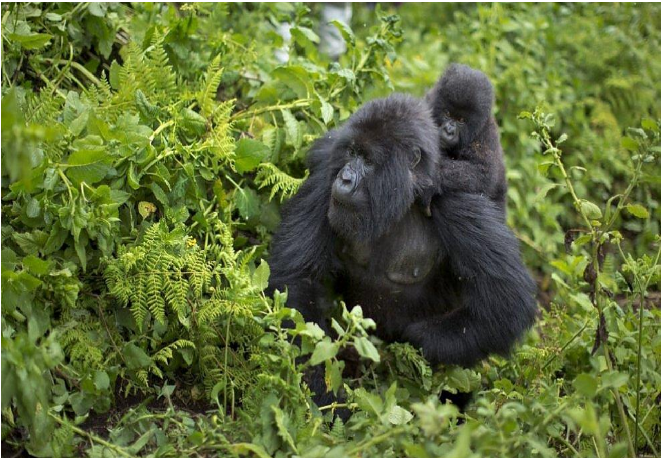
Vedere i gorilla di montagna nel Bwindi Forest National Park, in Uganda