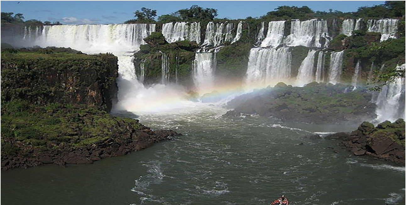
Vedere le cascate di Iguazu, tra le più grandi del mondo

Sono tantissimi i viaggi meravigliosi che si possono fare nel mondo. Eppure capita spesso di avere tanta voglia di partire ma di non sapere dove andare. A volte è difficile scegliere la destinazione di un viaggio e le innumerevoli possibilità invece di aiutarci ci possono confondere. Se ancora non avete deciso la meta del vostro viaggio, ecco una lista che potrebbe venirci in aiuto. Vi abbiamo inserito 100 proposte che comprendono alcune delle città più belle del mondo, tante meraviglie naturali e alcune esperienze da provare almeno una volta nella vita. Scegliete quelle che preferite e inseritele nella vostra lista di luoghi da scoprire.