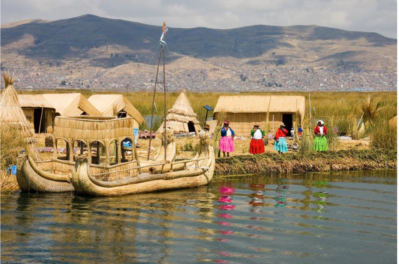
Far visita ad una famiglia Uros su una delle isole galleggianti del lago Titicaca, in Bolivia