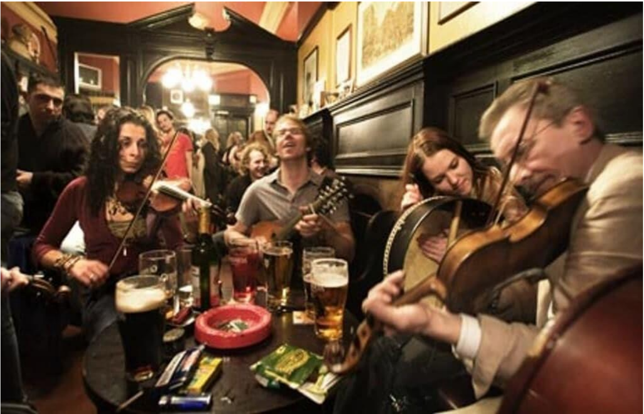
Trascorrere una serata con musica e birra in un vecchio pub irlandese