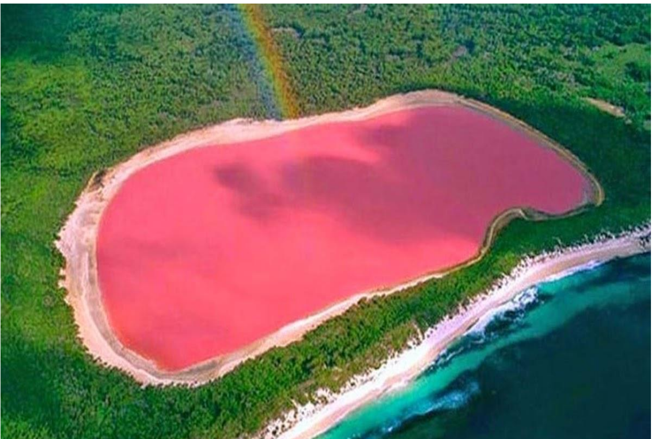
Fare il bagno nelle acque rosa del Lake Hillier in Australia