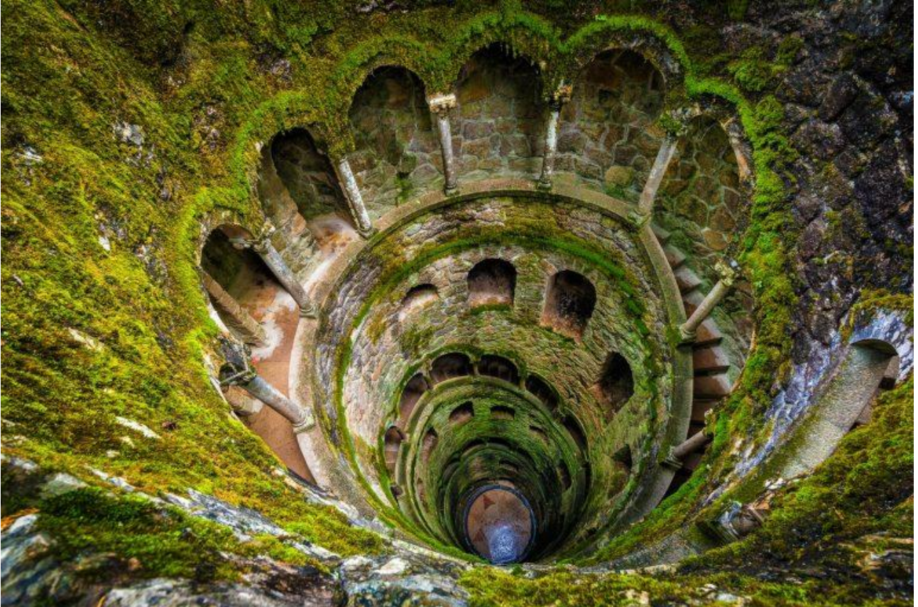
Esplorare la torre al contrario del Pozzo della Quinta da Regaleira, a Sintra, in Portogallo