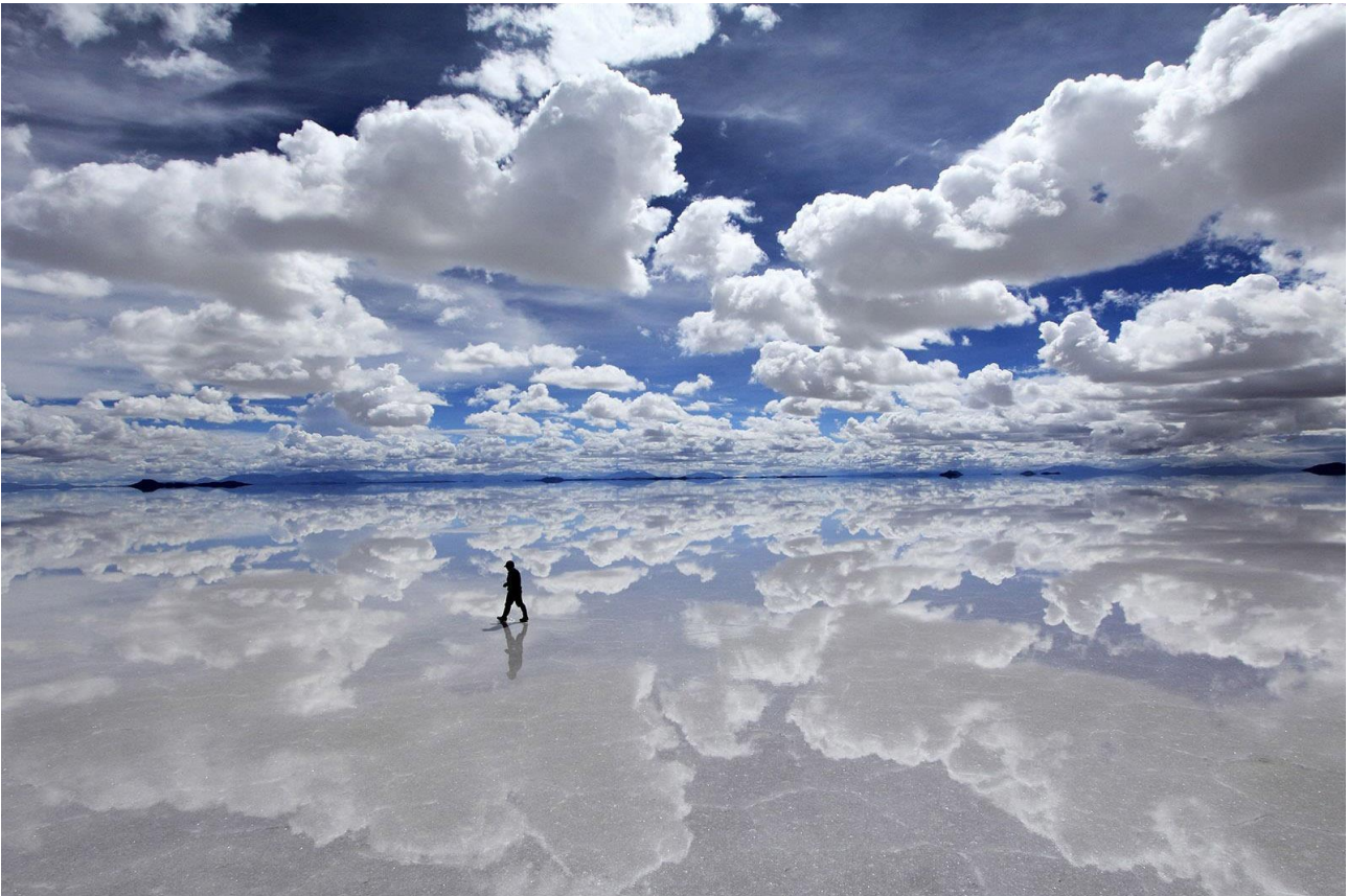
Camminare nel Salar de Uyuni, in Bolivia, il più grande deserto di sale del mondo