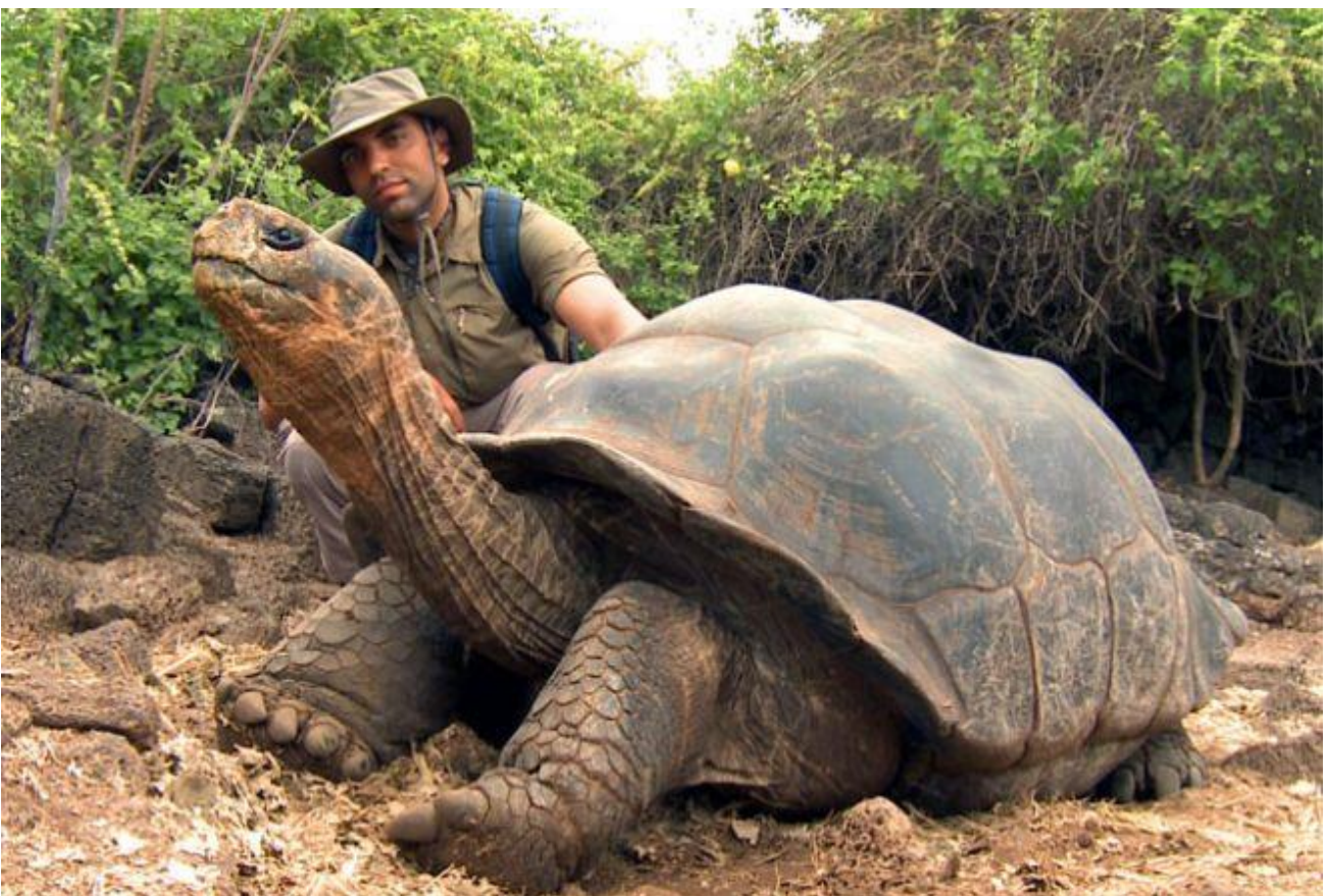
Passeggiare con le tartarughe giganti delle Galapagos