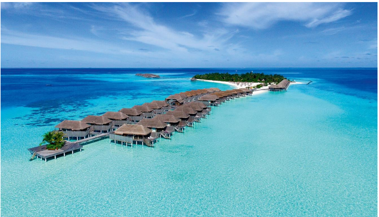
Alloggiare in un rifugio di lusso sospeso sul mare delle Maldive