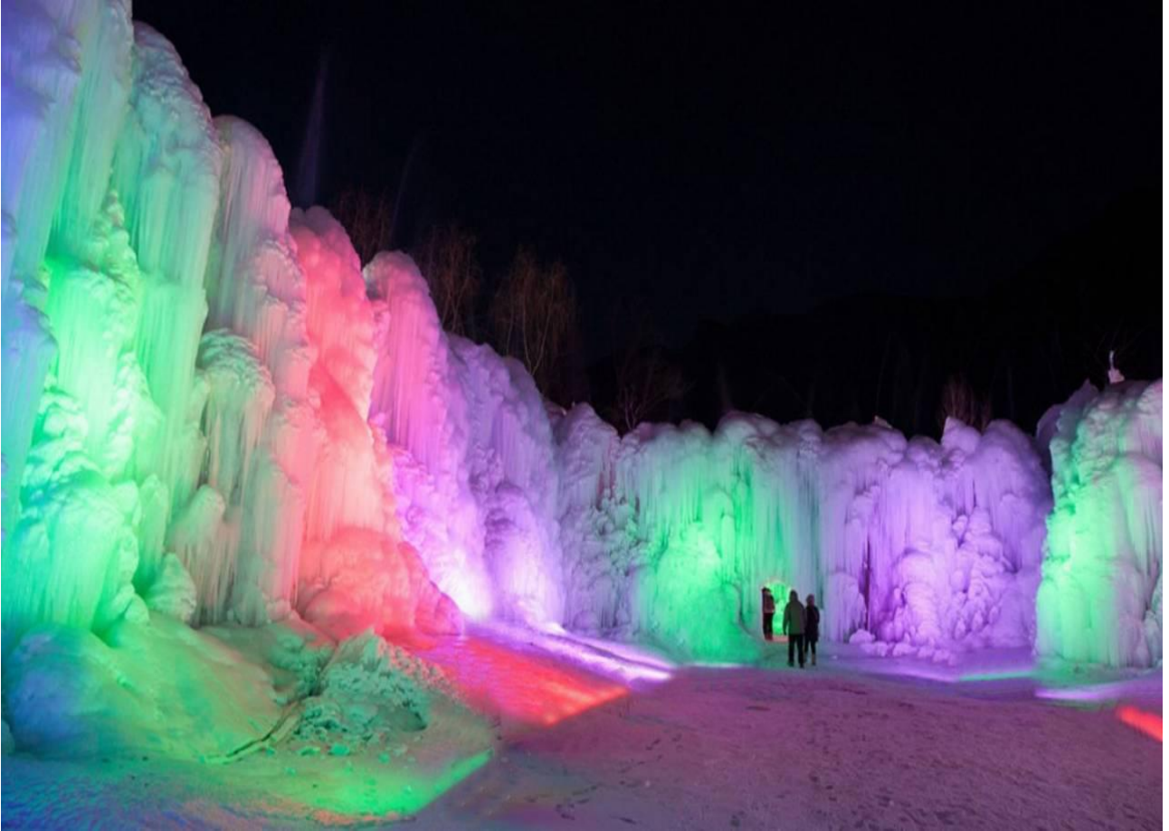
Ammirare le cascate ghiacciate di Shíjiāzhuāng, in Cina, spettacolarizzate da un gioco di colori