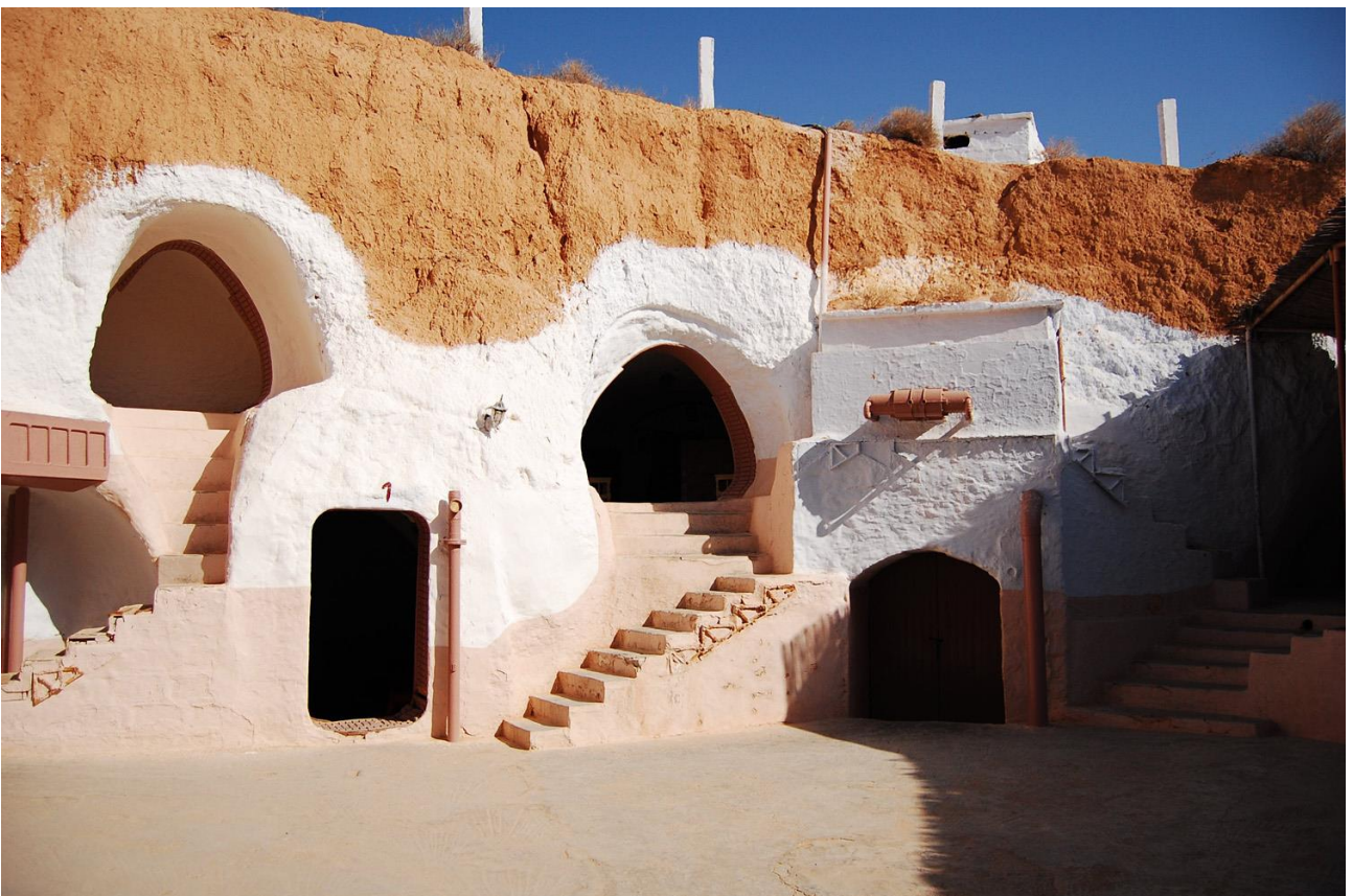
Dormire nelle abitazioni troglodite di Matmata, in Tunisia