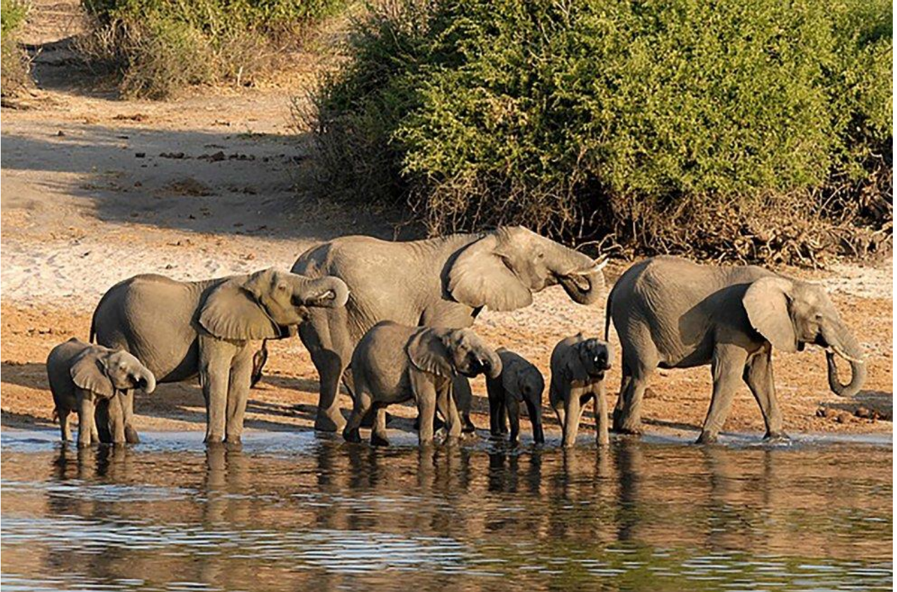
Osservare gli elefanti che si abbeverano al fiume in Sud Africa