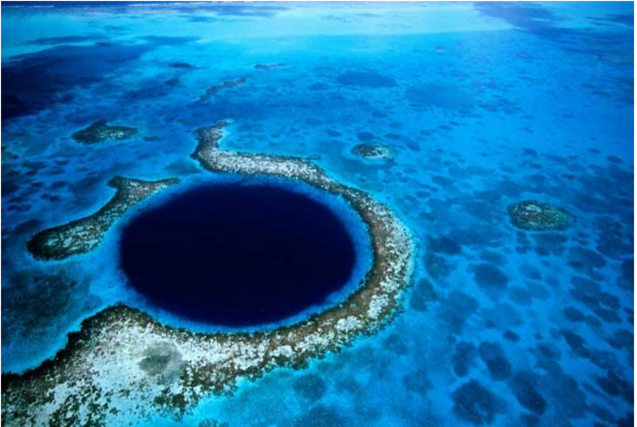
Sorvolare l'Abisso Blu, una voragine nel mare, profonda oltre 120 metri, al largo del Belize