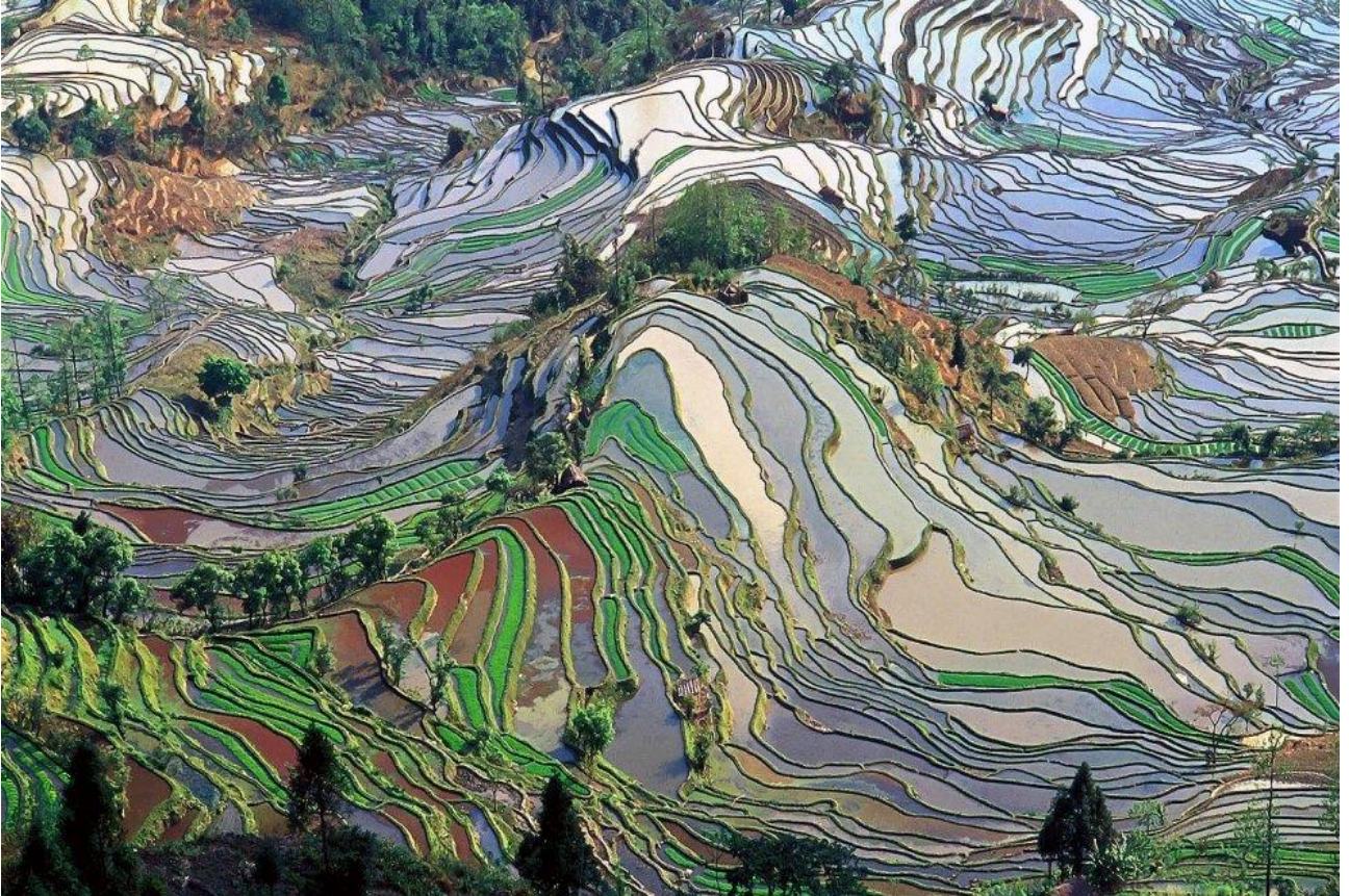
Ammirare i colori delle terrazze dello Yunnan, in Cina