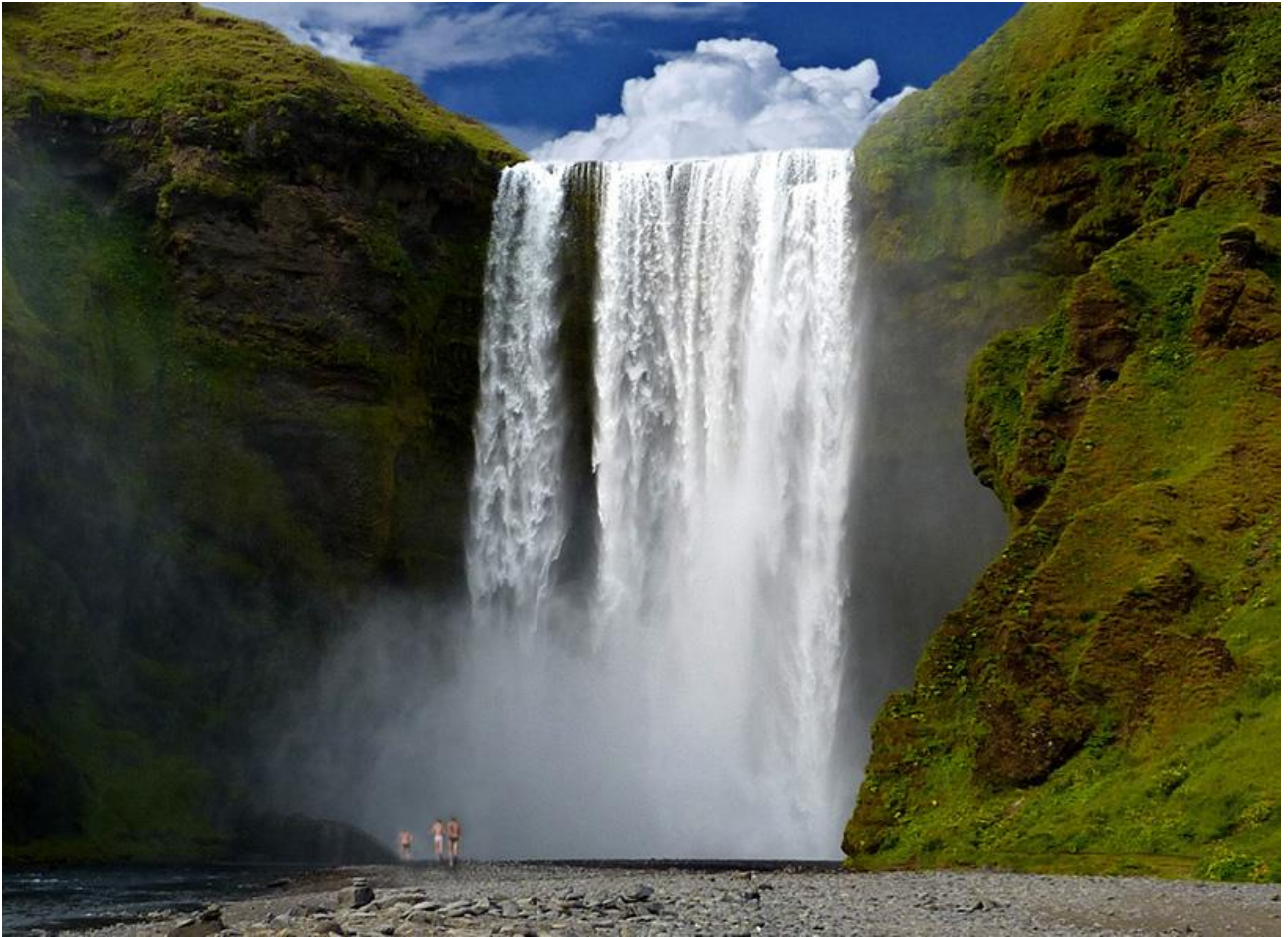
Fare il bagno sotto la Cascata Skogafoss, in Islanda