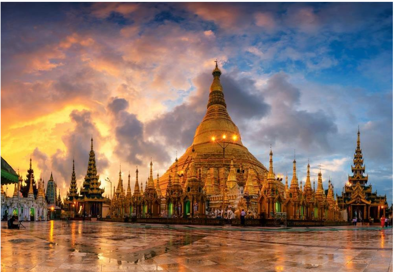
Scoprire le Pagode d'Oro del Myanmar, la favolosa Birmania