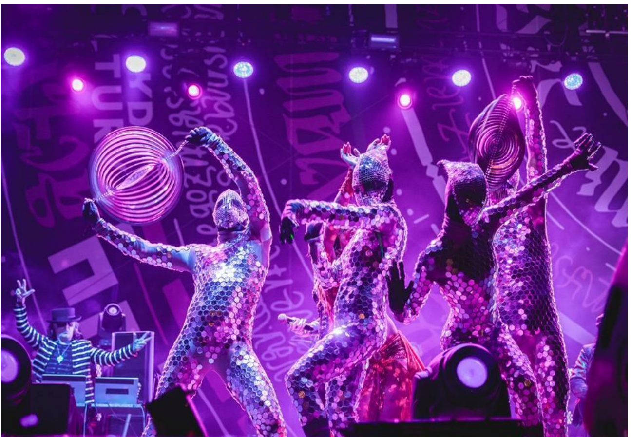
Partecipare al concerto di apertura dell'Ozora Festival in Ungheria