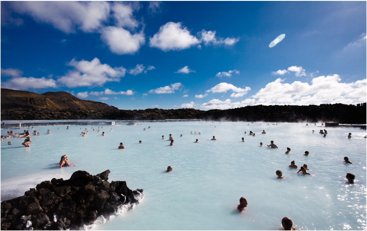
Fare il bagno nelle acque calde della Laguna Blu di Reykjavík, in Islanda