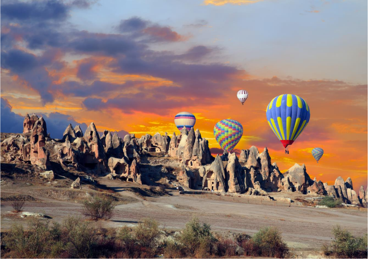
Sorvolare in mongolfiera i “camini delle fate” della Cappadocia, in Turchia