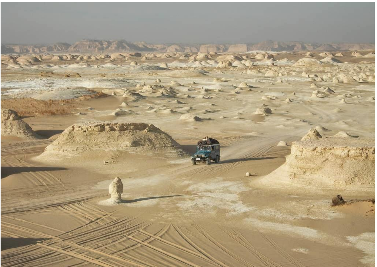
Esplorare il Deserto Bianco, in Egitto