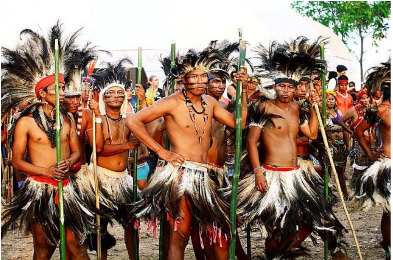
Assistere alle danze degli indios dell'Amazzonia, in Brasile