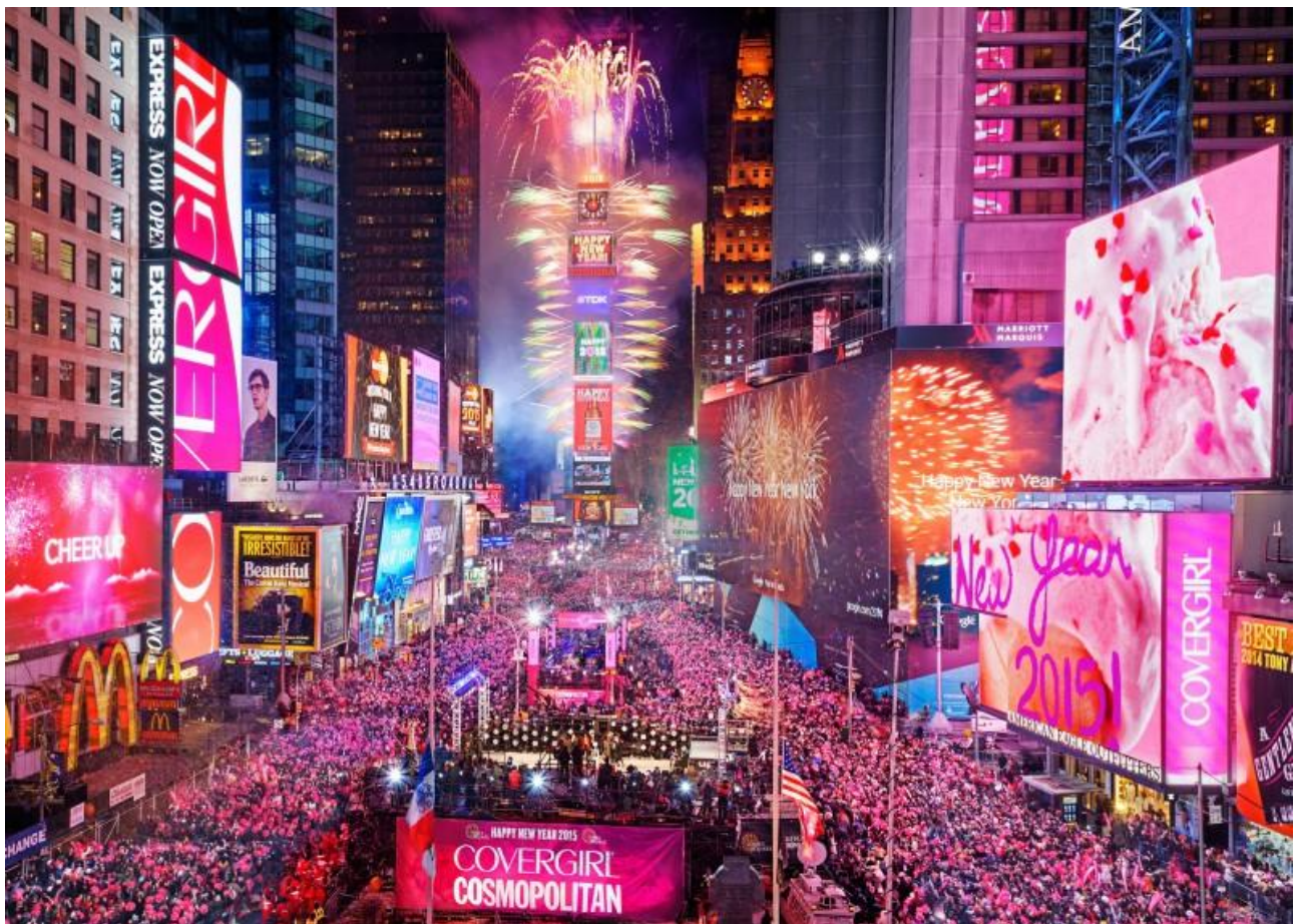
Trascorrere la notte di Capodanno a Time Square, a New York