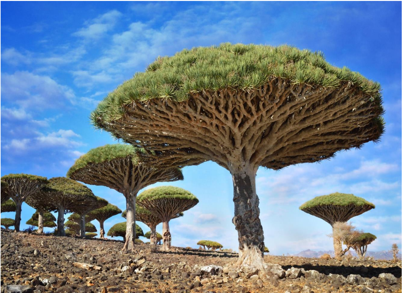
Scoprire gli strani alberi dell'Isola di Socotra, in Yemen