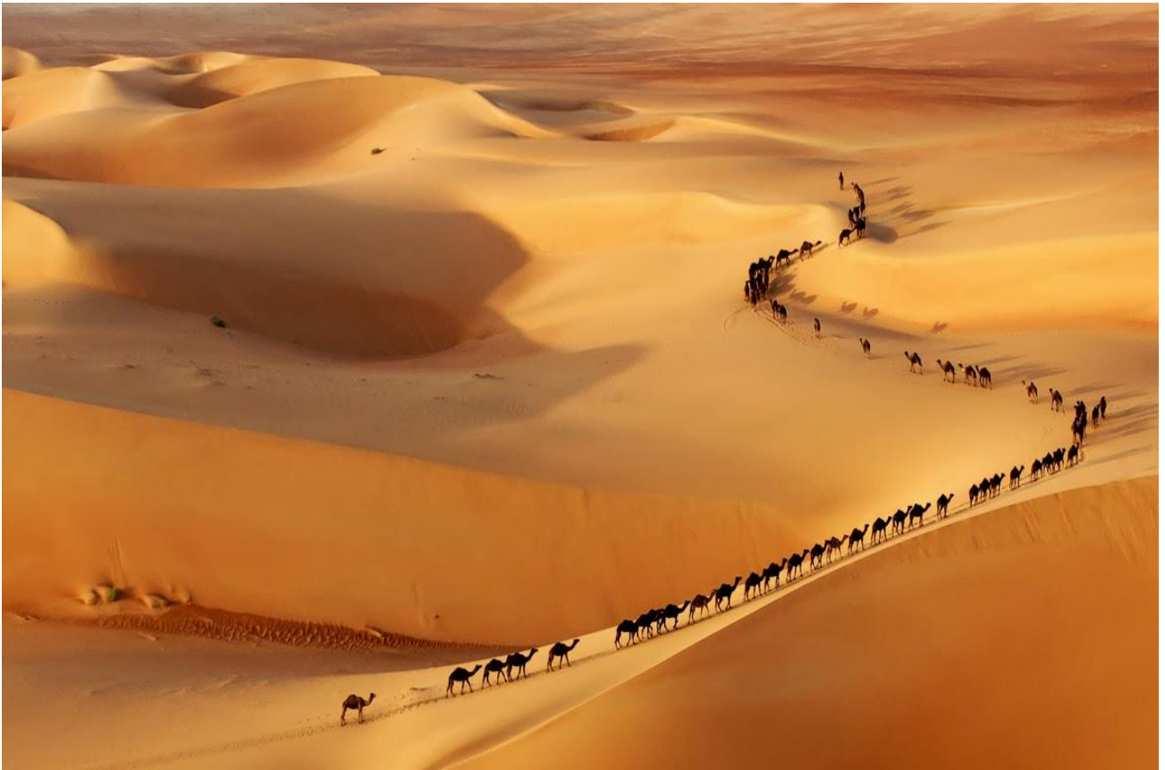
Seguire una carovana di dromedari nel deserto Erg Chebbi in Marocco