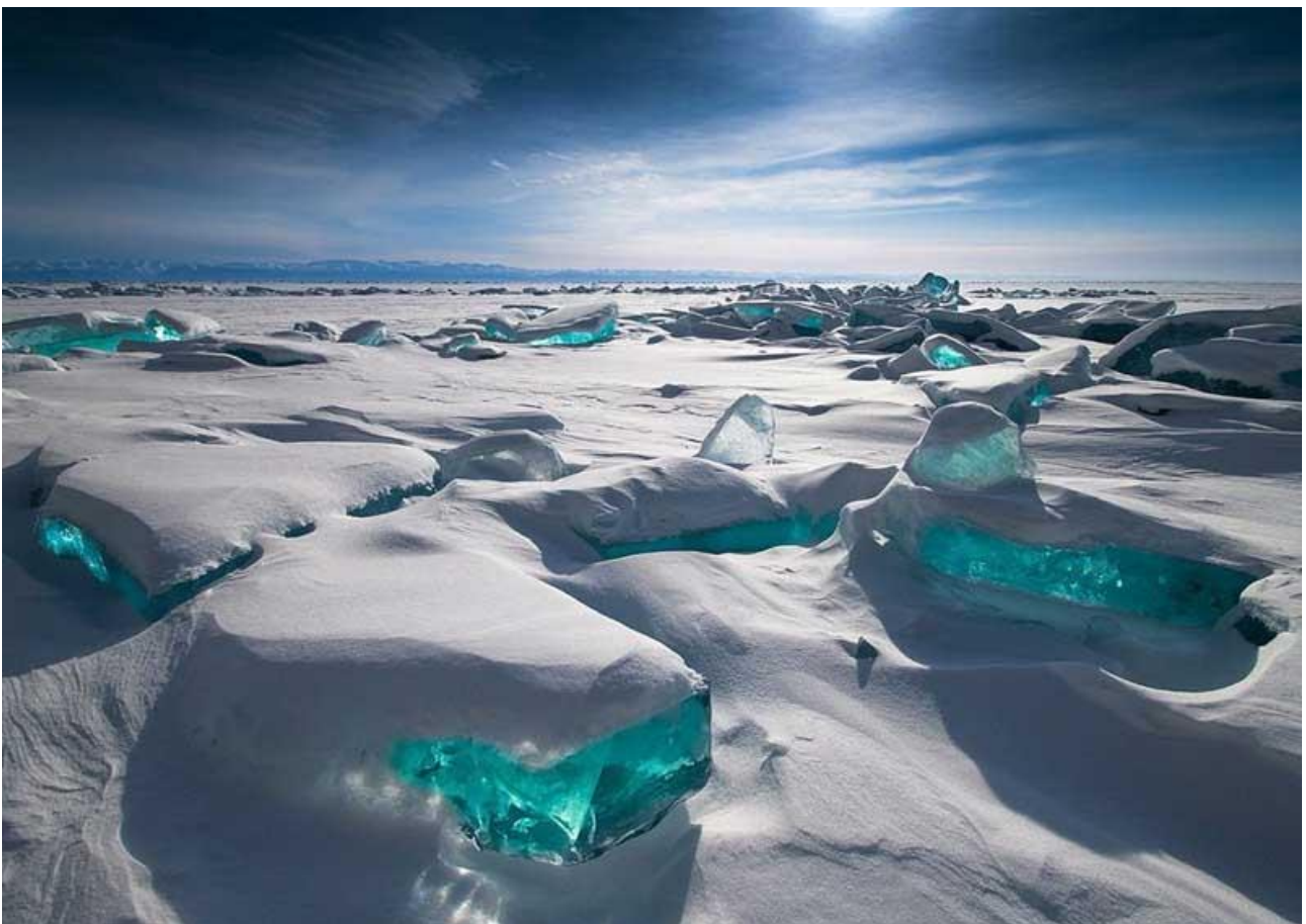
Ammirare i frammenti di ghiaccio color turchese del Lago Baikal, in Siberia, durante il disgelo