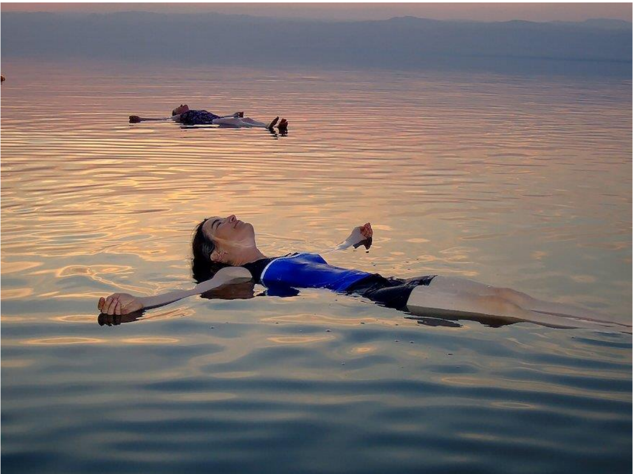
Galleggiare nel Mar Morto, in Israele o Giordania