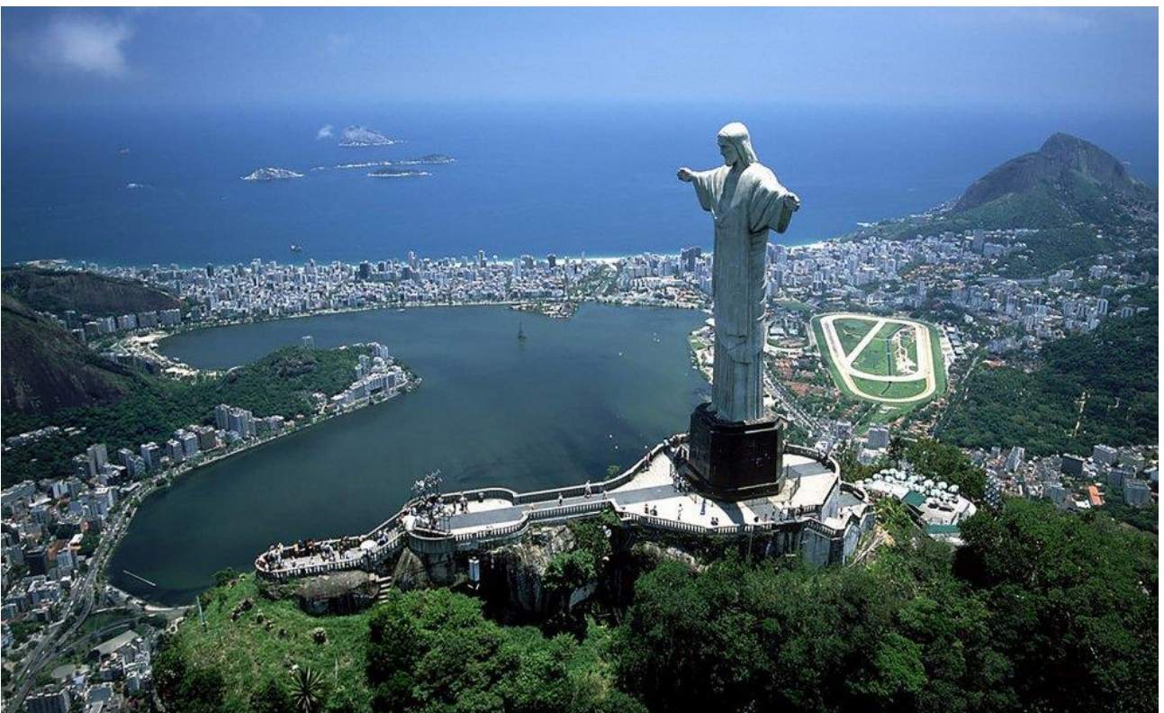
Salire fino alla statua del Cristo Redentore sul Corcovado, a Rio de Janeiro, in Brasile