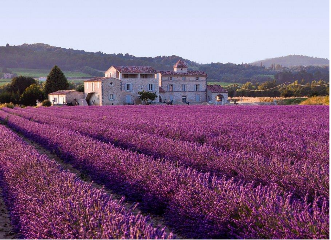
Ammirare la fioritura dei campi di lavanda in Provenza, Francia