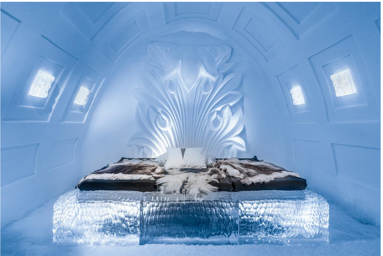
Trascorrere una notte presso l’Ice Hotel di Jukkasjarvi, in Svezia