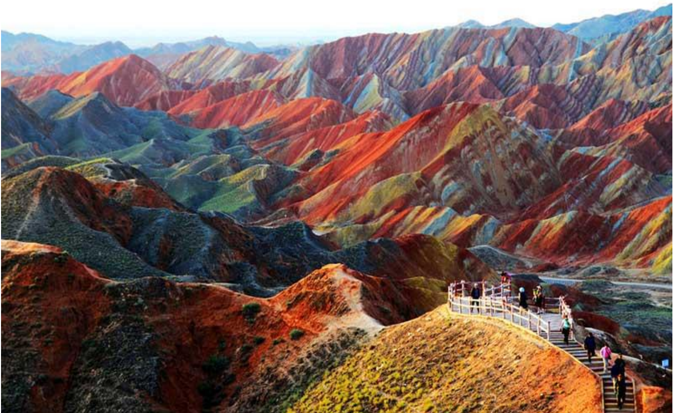
Scoprire le montagne colorate di Zhangye Danxia, a Gansu (vicino al Deserto del Gobi), in Cina