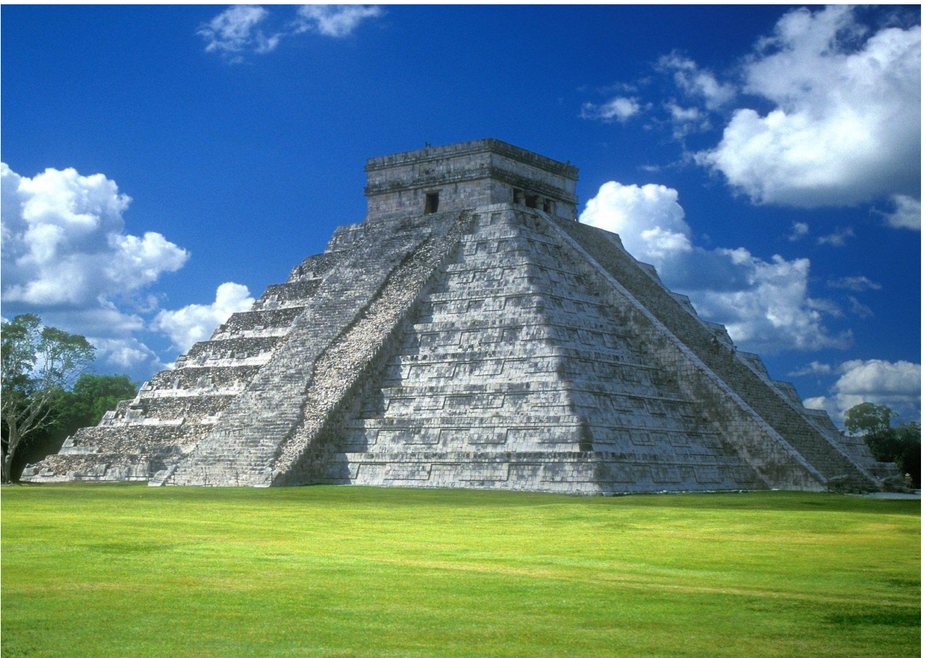
Salire sulla Piramide di Kukulcan a Chichen Itza, in Messico