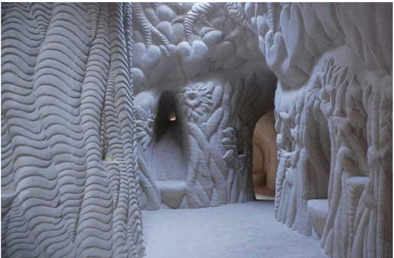
Visitare le grotte scavate e decorate a mano nel deserto del New Mexico dall'artista Ra Paulette