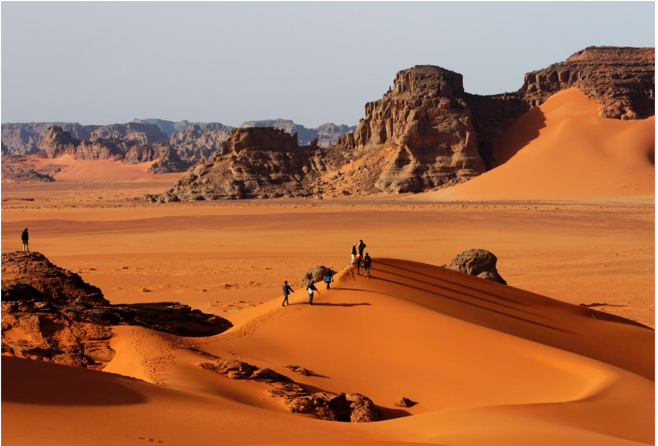
Camminare tra le dune del deserto dell' Akakus in Libia