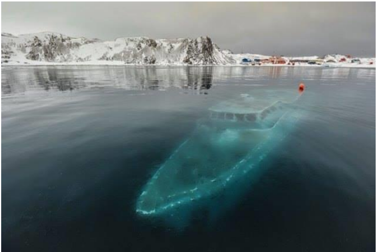
Osservare la nave affondata e intrappolata nei ghiacci che si intravede nelle acque dell'Antartide