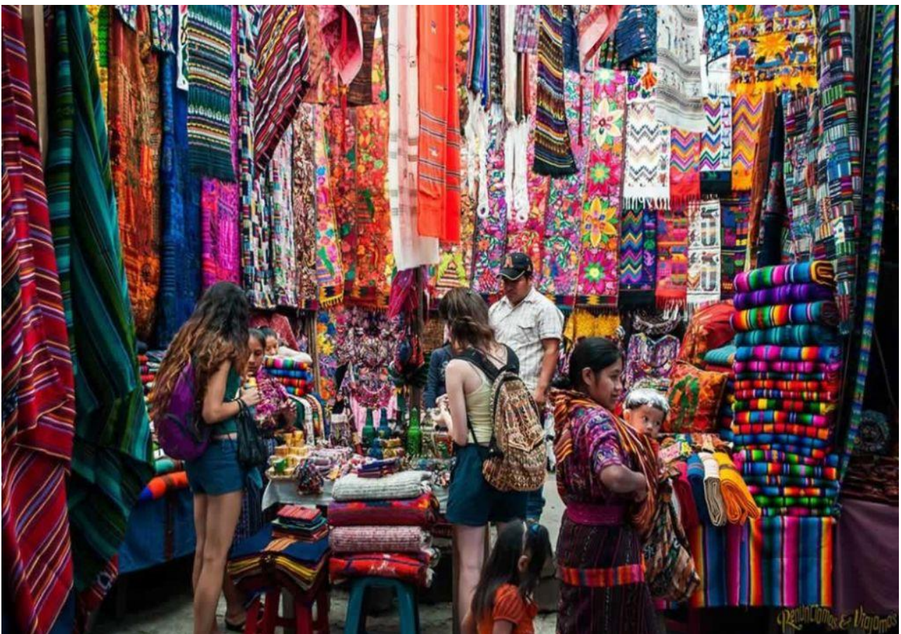
Perdersi tra le bancarelle del colorato mercato di Chichicastenango, in Guatemala