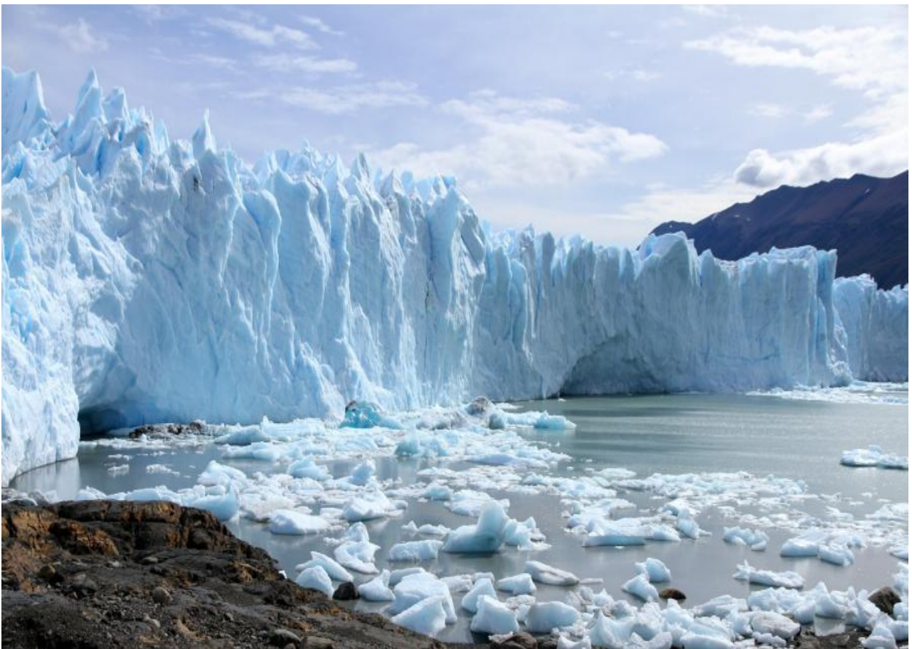
Ammirare lo spettacolare ghiacciaio Perito Moreno, in Argentina