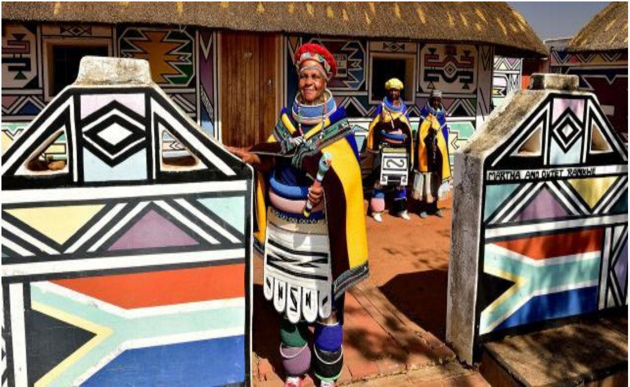
Visitare le case colorate della tribù dei Ndebele, in Sud Africa