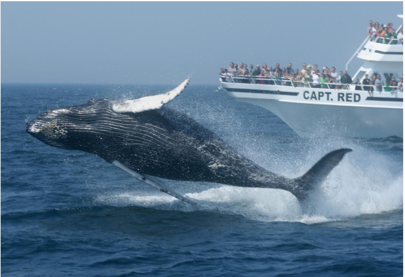
Osservare le balene nella Baia di San Lorenzo, in Canada