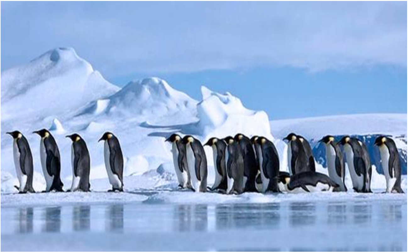
Seguire la marcia dei Pinguini Imperatore in Antartide