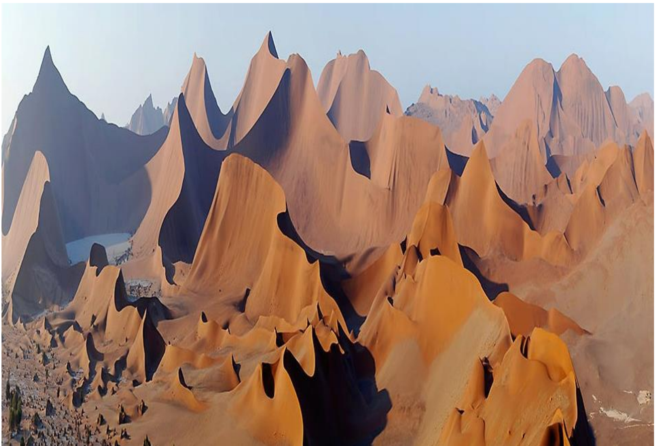
Ammirare le spettacolari rocce denominate “Cattedrale del vento”, in Namibia