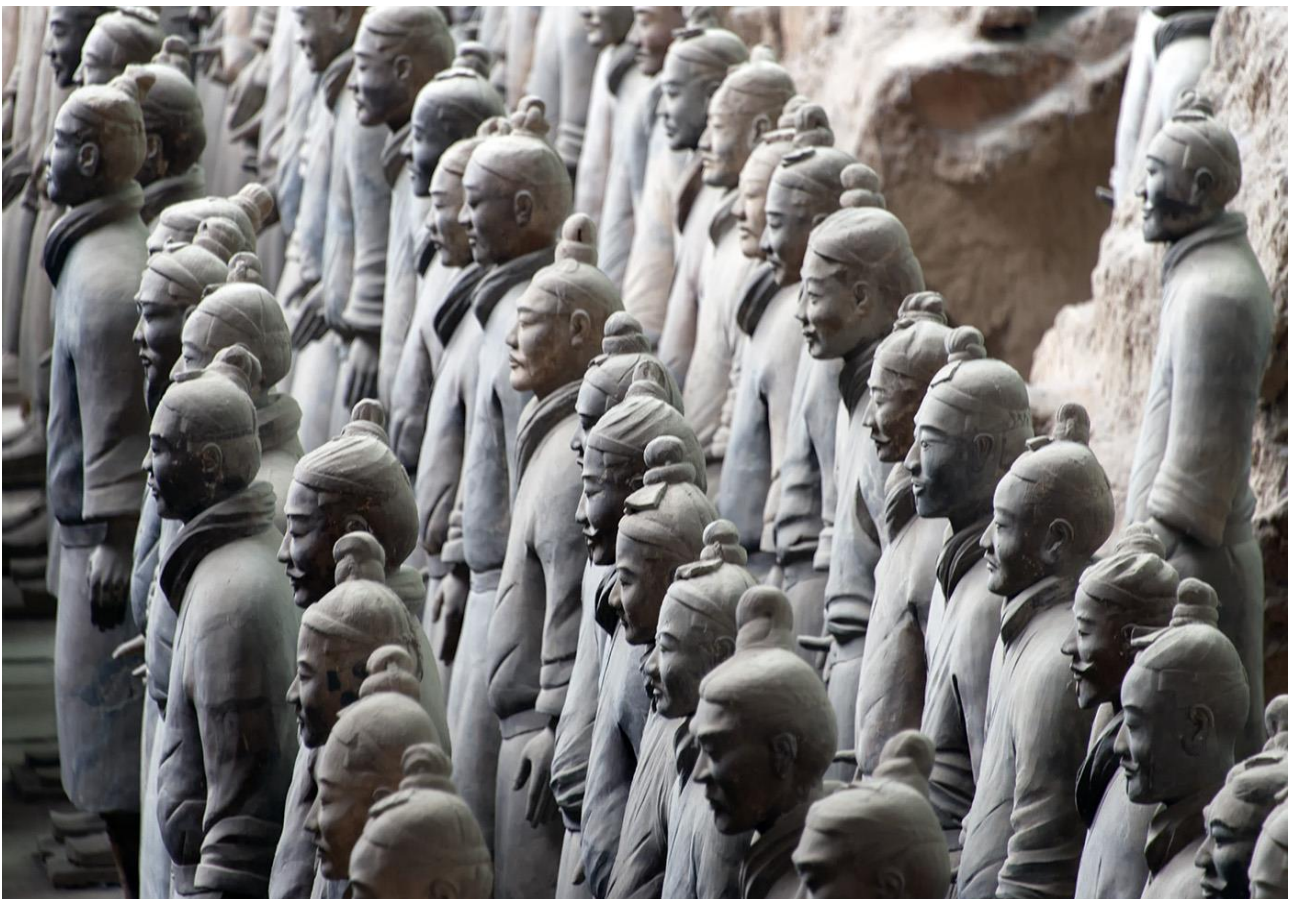
Ammirare lo spettacolare Esercito di Terracotta di Xian, in Cina