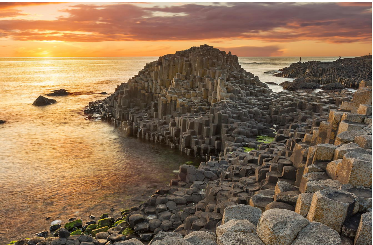
Camminare sul Sentiero dei Giganti, in Donegal (Irlanda)