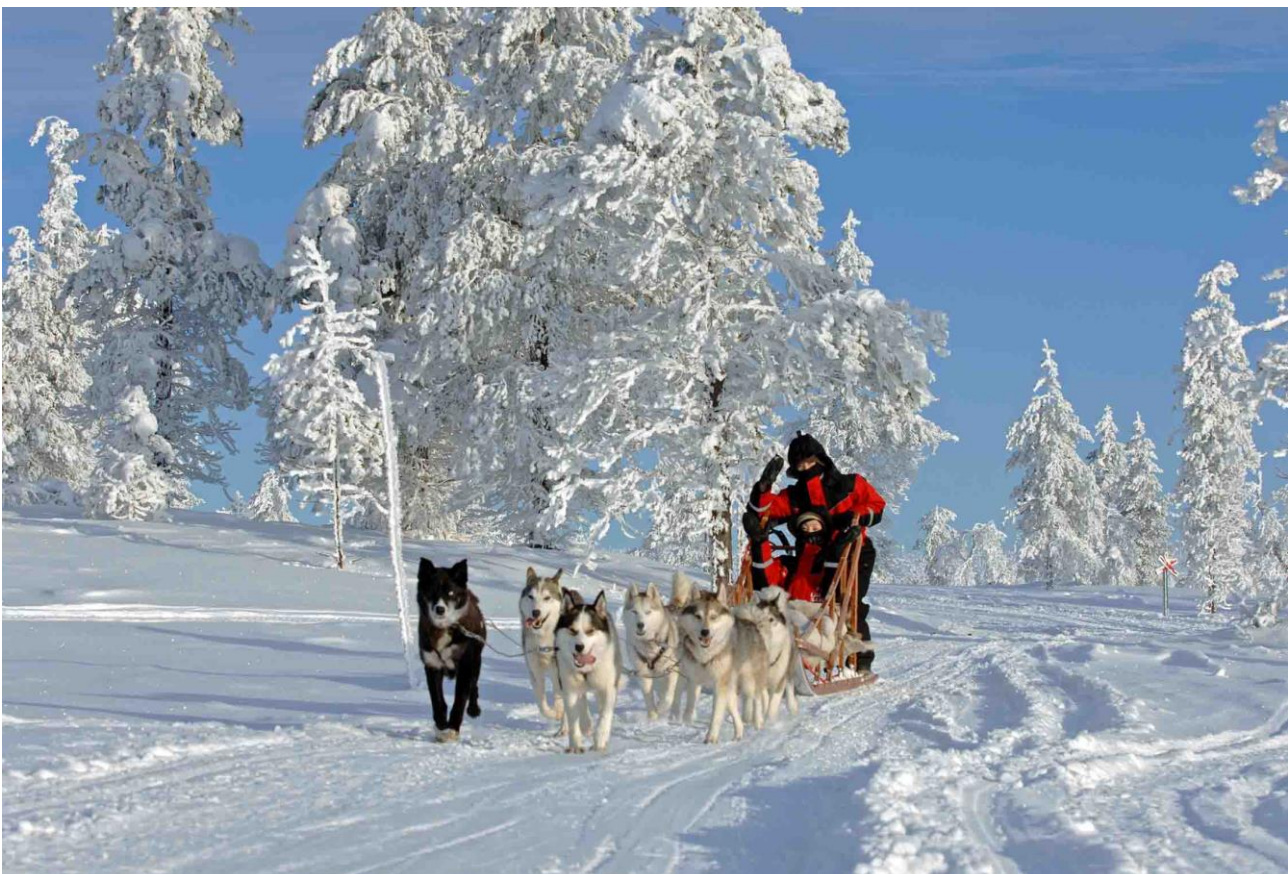
Fare un'escursione su una slitta trainata dai cani in Lapponia (Finlandia)