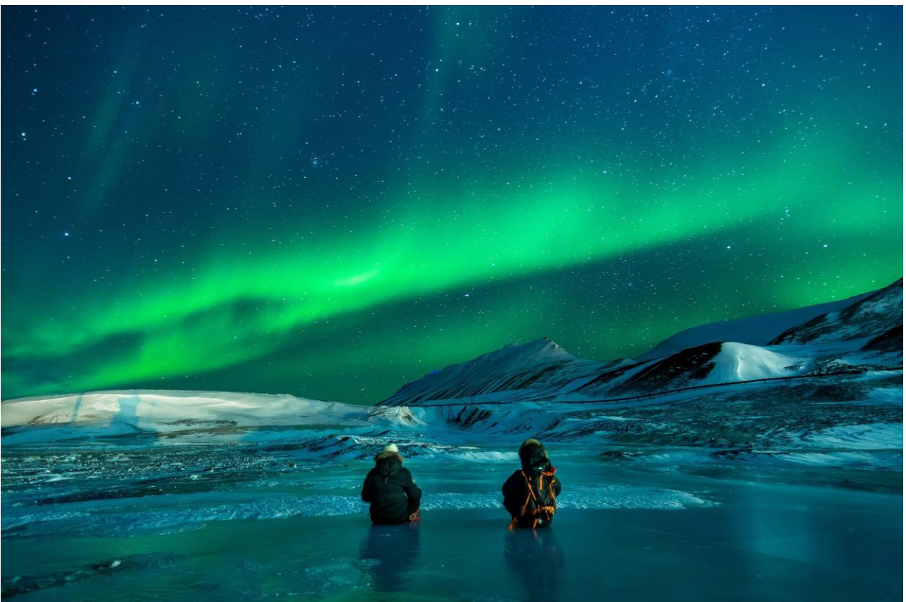
Assistere all’aurora boreale a Tromsø, in Norvegia, la città più a nord del mondo