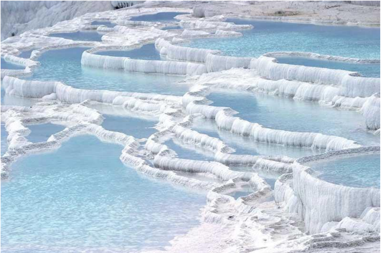
Ammirare la cascata bianca di Pamukkale, in Turchia