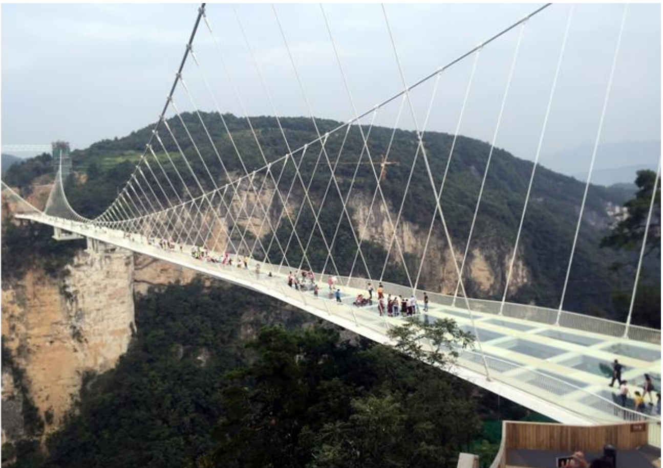
Passeggiare sul ponte di vetro più lungo del mondo sopra lo Zhangjiajie Grand Canyon, in Cina