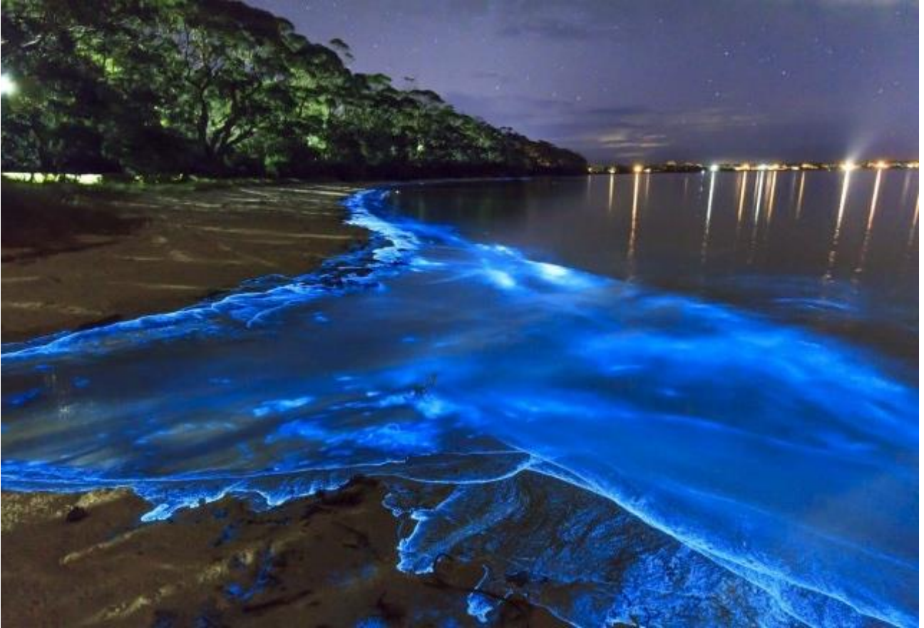
Ammirare le Onde Bioluminescenti sulla spiaggia di Manly, vicino a Sydney, in Australia