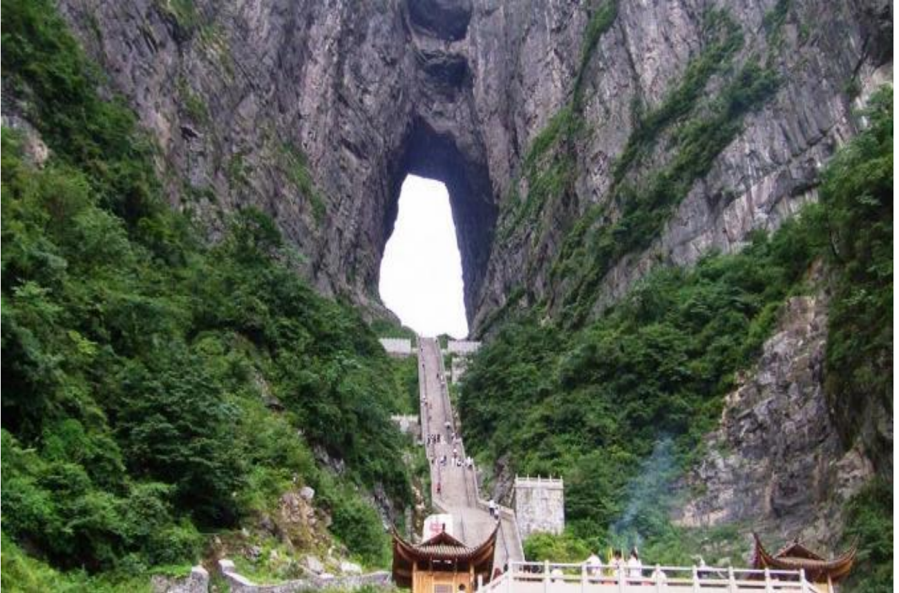
Attraversare il foro nella roccia sulla montagna Tianmen, in Cina