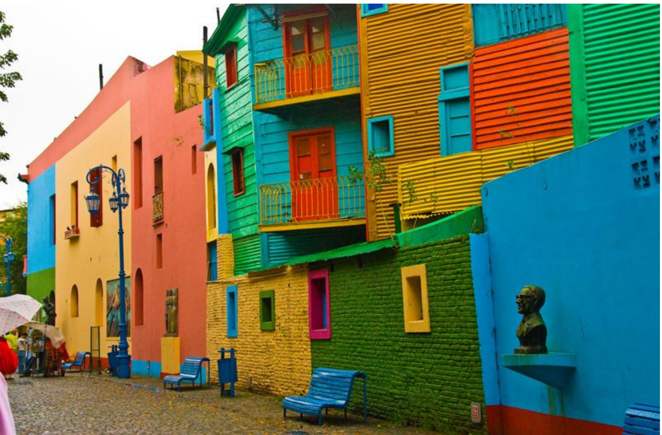
Passeggiare tra le coloratissime case del quartiere La Boca di Buenos Aires, in Argentina