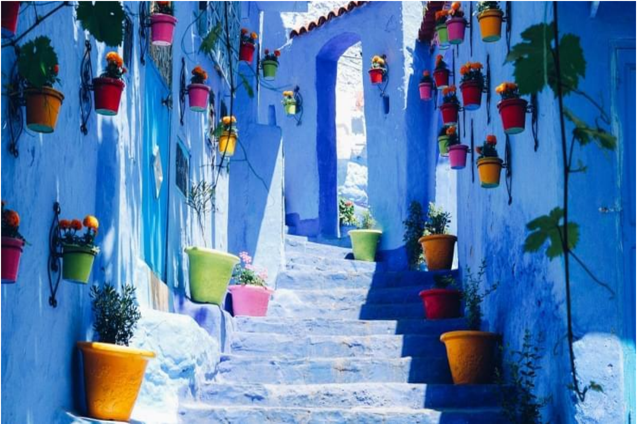
Passeggiare tra le case blu di Chefchaouen, nei pressi di Tangeri e Ceuta, in Marocco