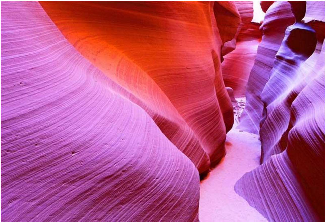
Scoprire i colori dell'Antelope Canyon, in Arizona, Stati Uniti