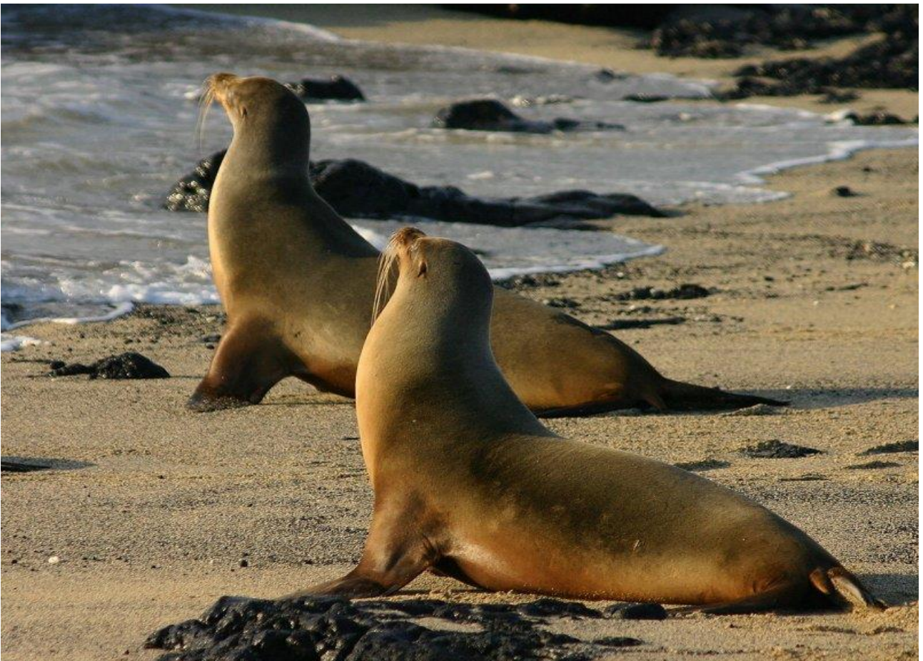
Avvicinarsi ai leoni marini giganti delle Galapagos