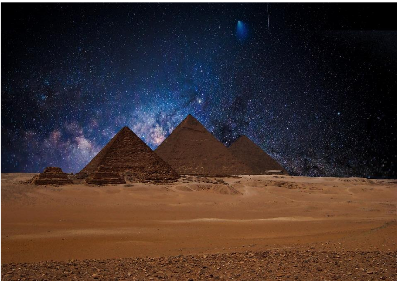
Osservare il cielo stellato sopra le Piramidi di Giza, in Egitto