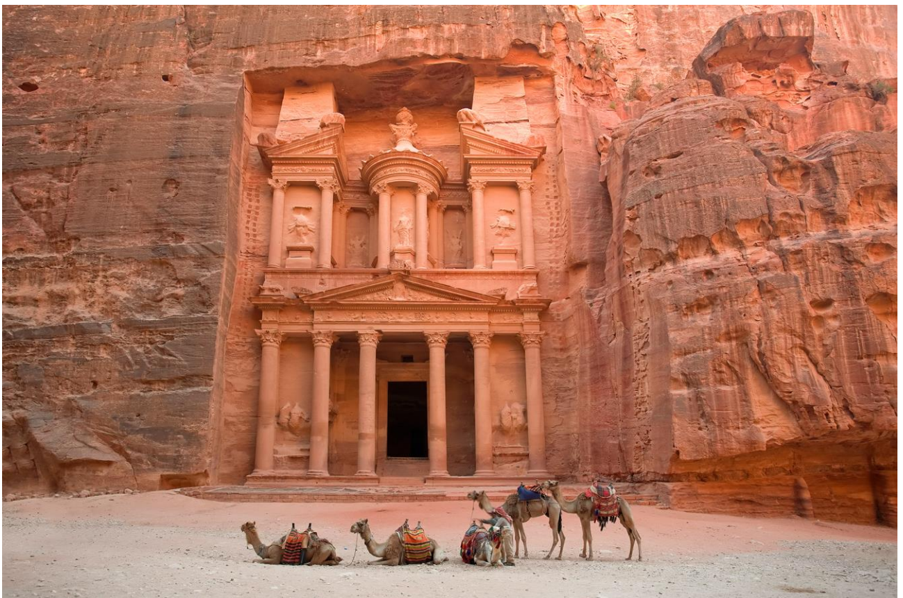
Passeggiare nella città perduta di Petra, in Giordania