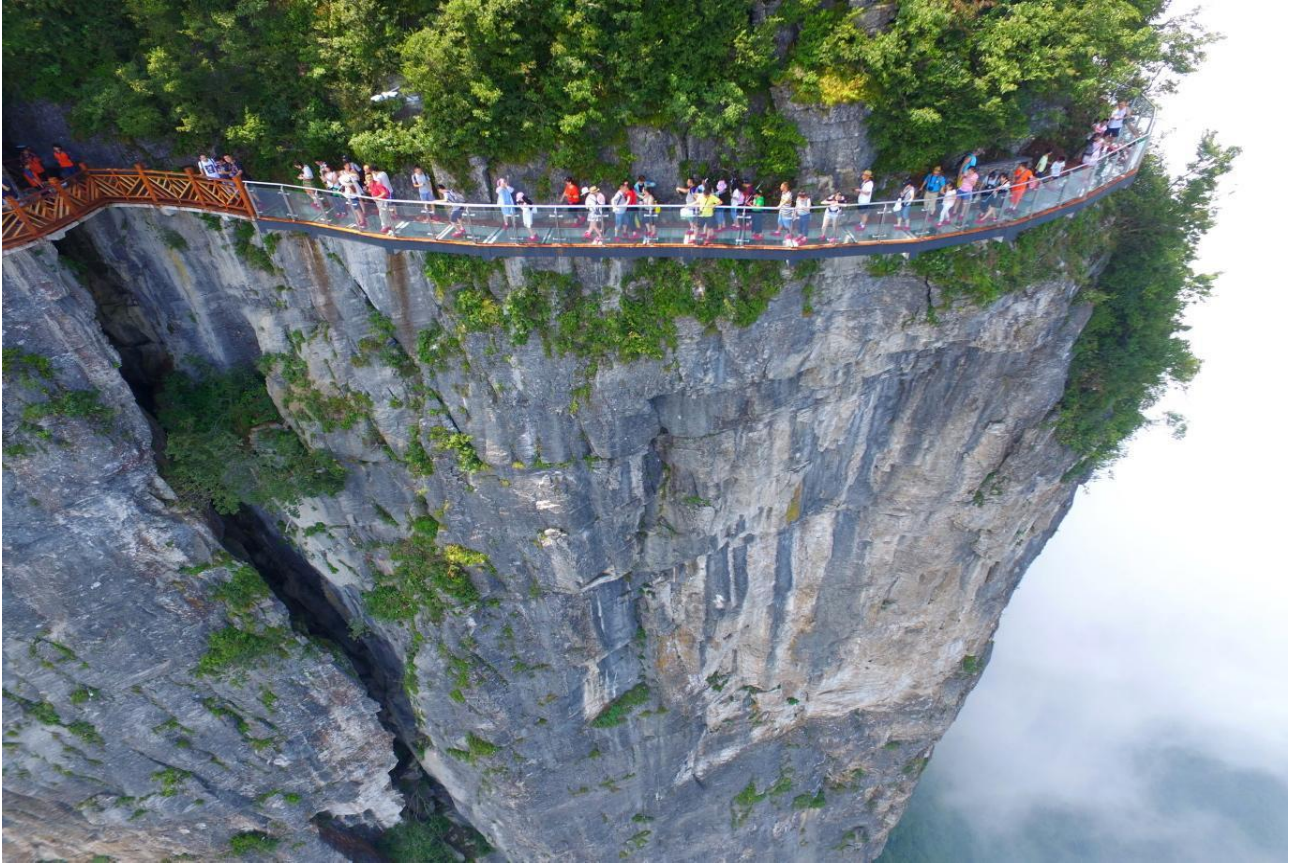
Passeggiare sulla passerella di vetro sospesa nel vuoto nello Zhangjiajie National Park, in Cina