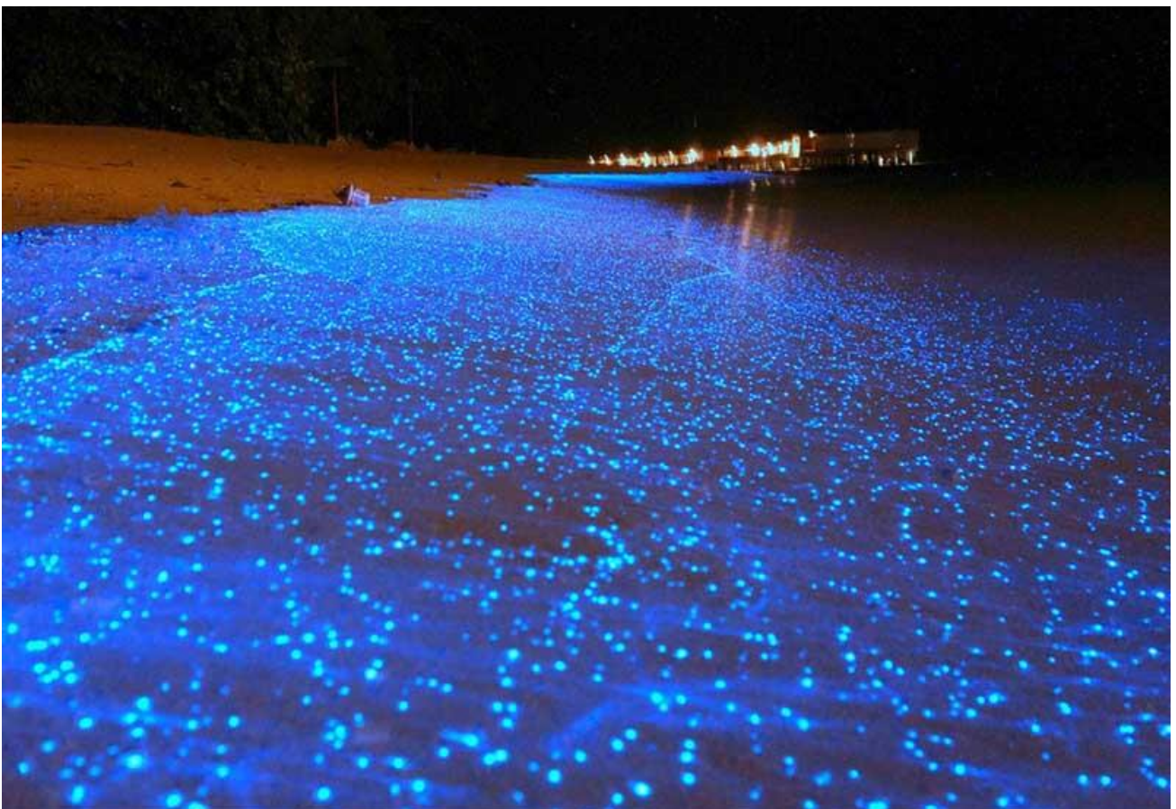
Ammirare il romantico mare di stelle sull'Isola di Vaadhoo, alle Maldive