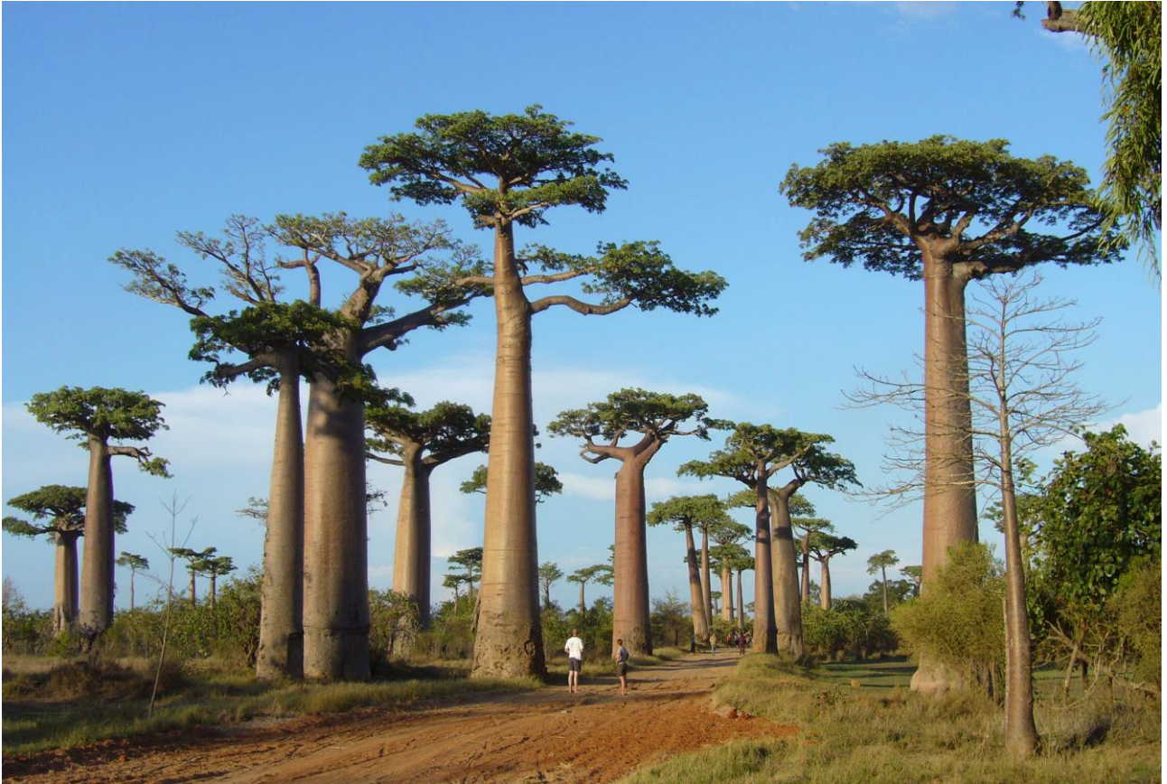
Percorrere il “Viale dei Baobab” nella Foresta dei Baobab di Morondava, in Madagascar