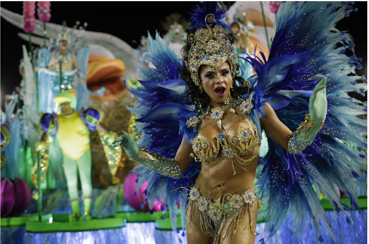
Assistere alla grande Parata di Samba durante il Carnevale di Rio de Janeiro, in Brasile