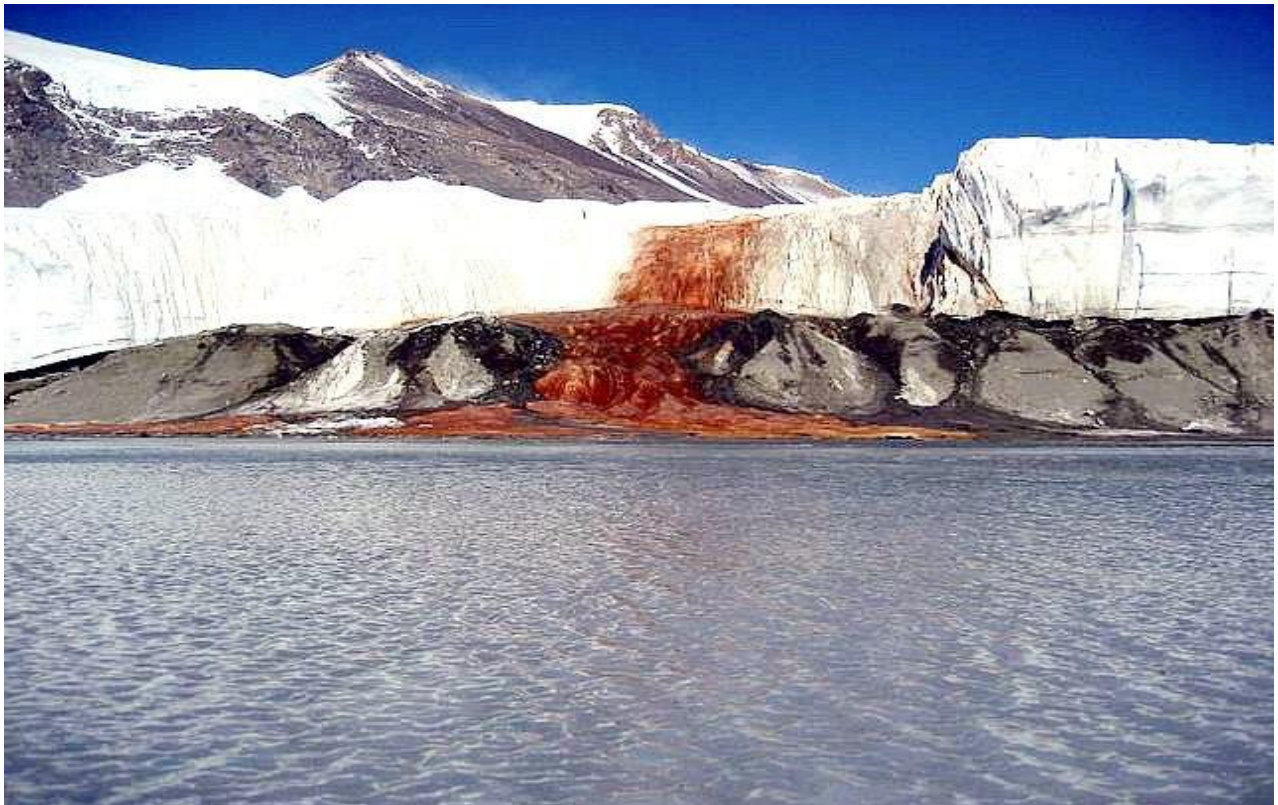
Ammirare le Blood Falls, le cascate rosse del Ghiacciaio Taylor, nell'Antartico orientale