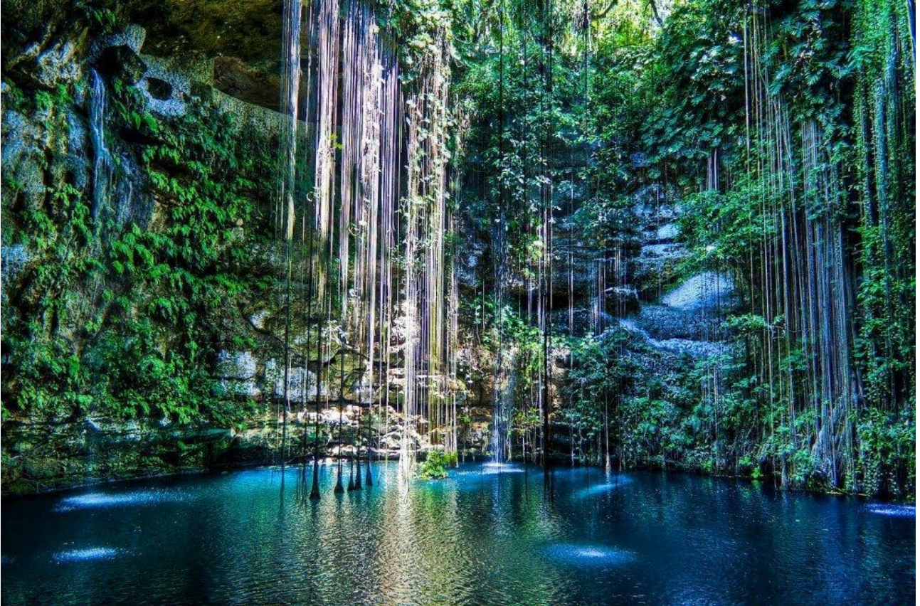
Fare il bagno in una piscina naturale dello Yucatan, in Messico