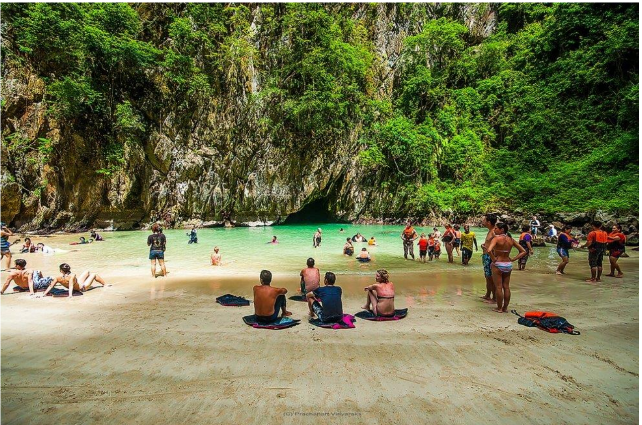
Fare il bagno a Sa Morakot, la Grotta di Smeraldo sull'isola di Koh Mukin, in Thailandia