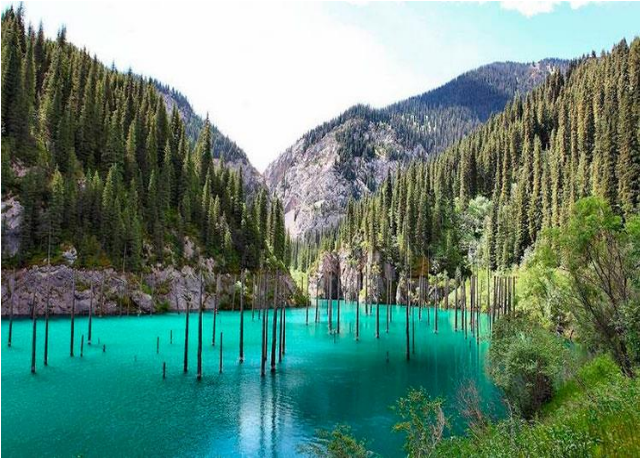
Scoprire la foresta sommersa del Lago Kaindy, in Kazakhstan