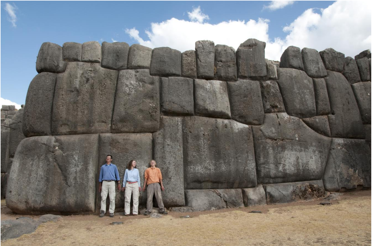
Verificare quanto sono grandi le mura del Tempio di Sacsayhuamán, in Perù