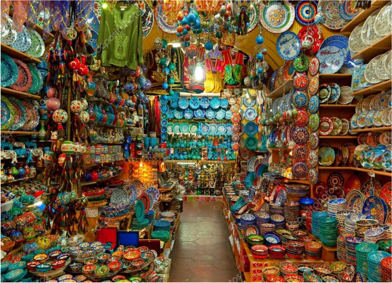
Perdersi nel Grand Bazaar di Istanbul, in Turchia