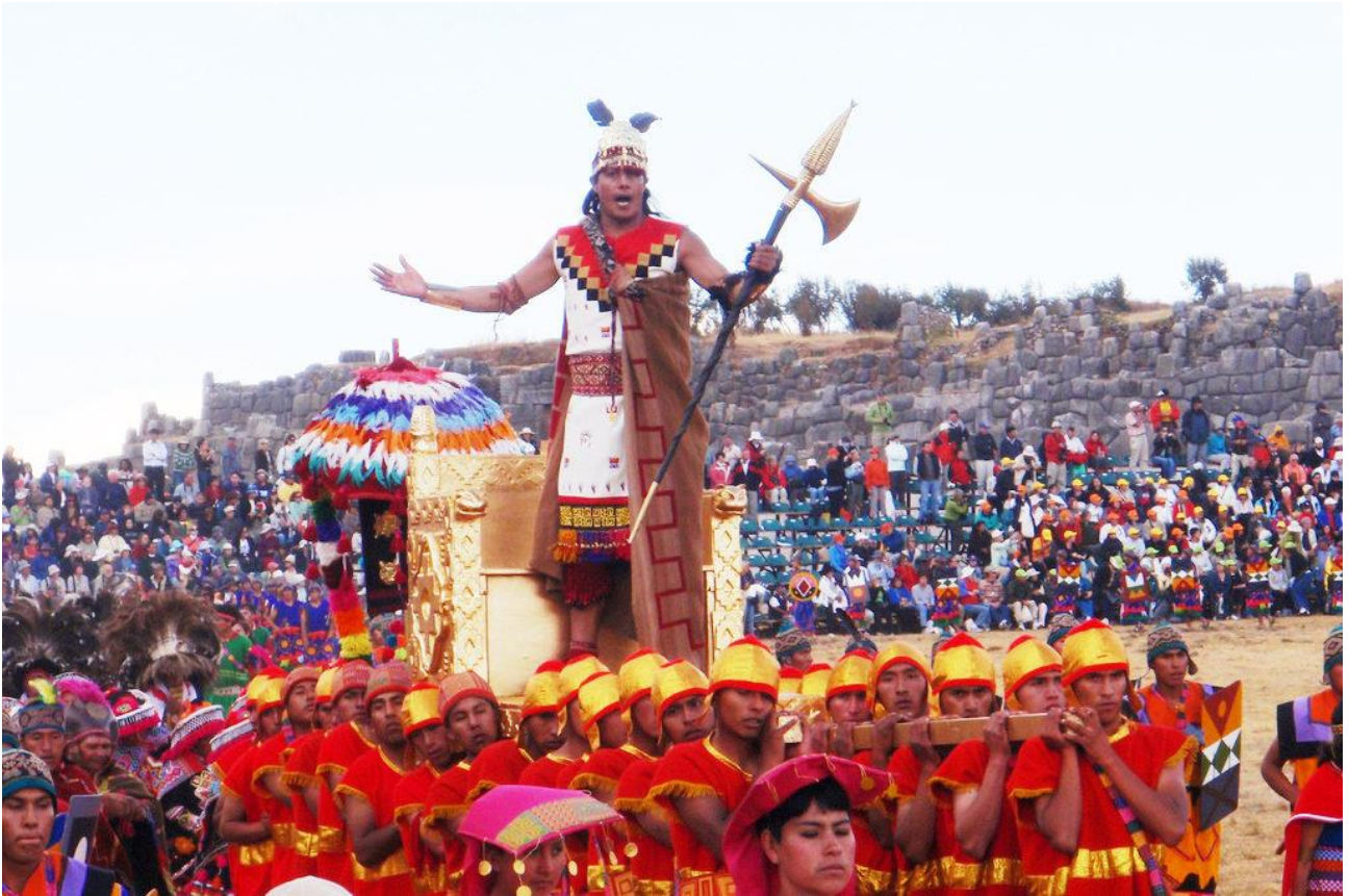
Assistere alla festa dell'Inti Raymi a Cusco, in Perù