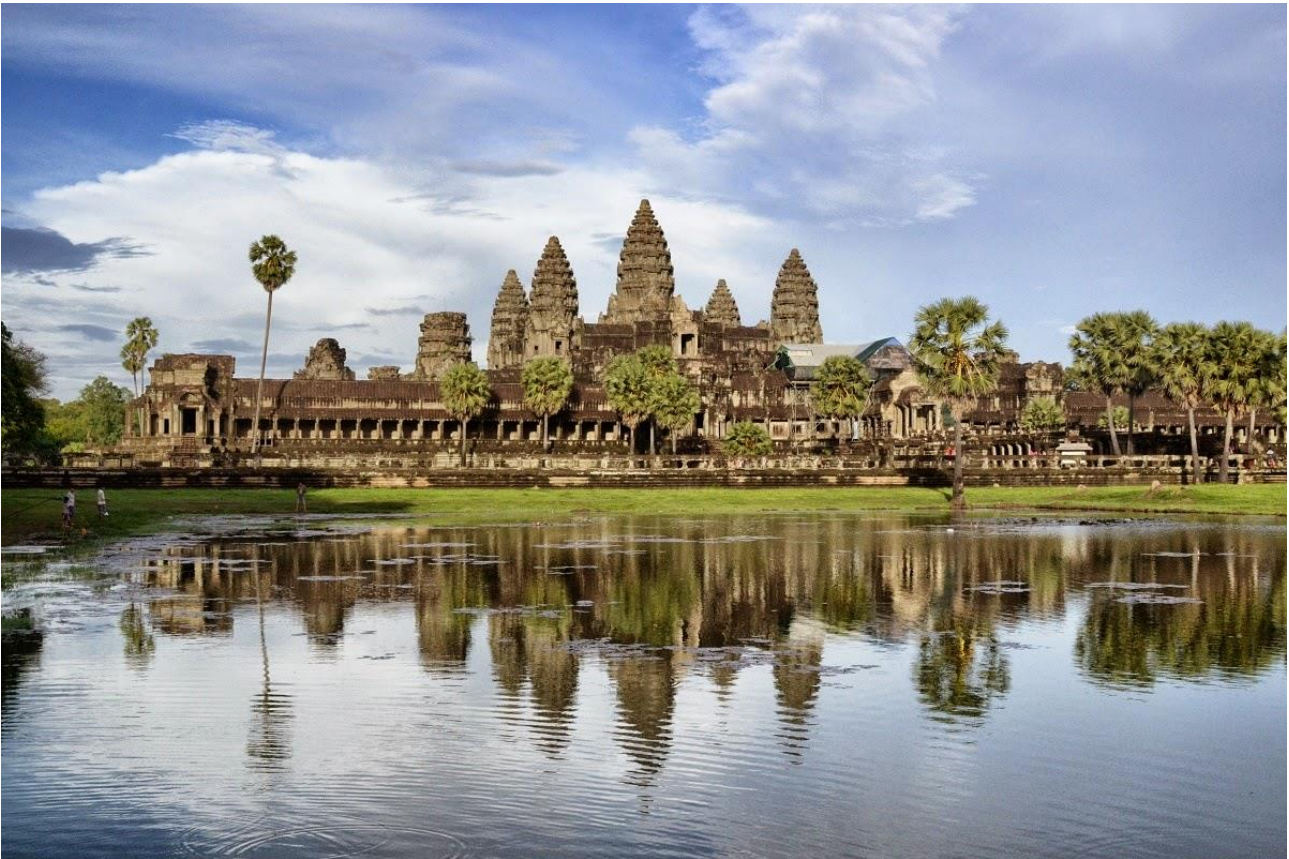
Visitare i templi di Angkor Wat, in Cambogia