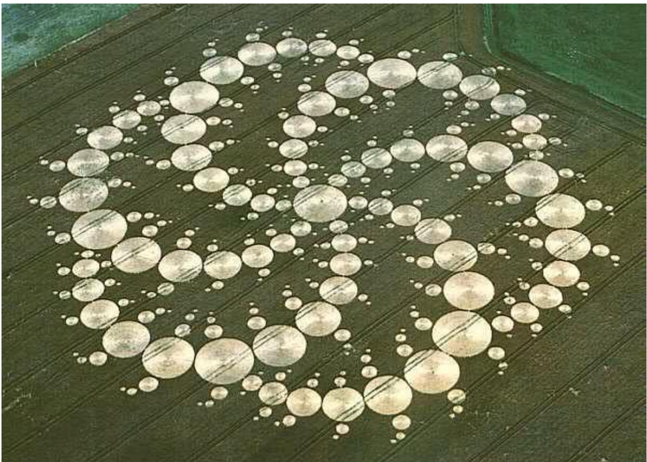
Sorvolare un cerchio nel grano nel Wiltshire, in Inghilterra