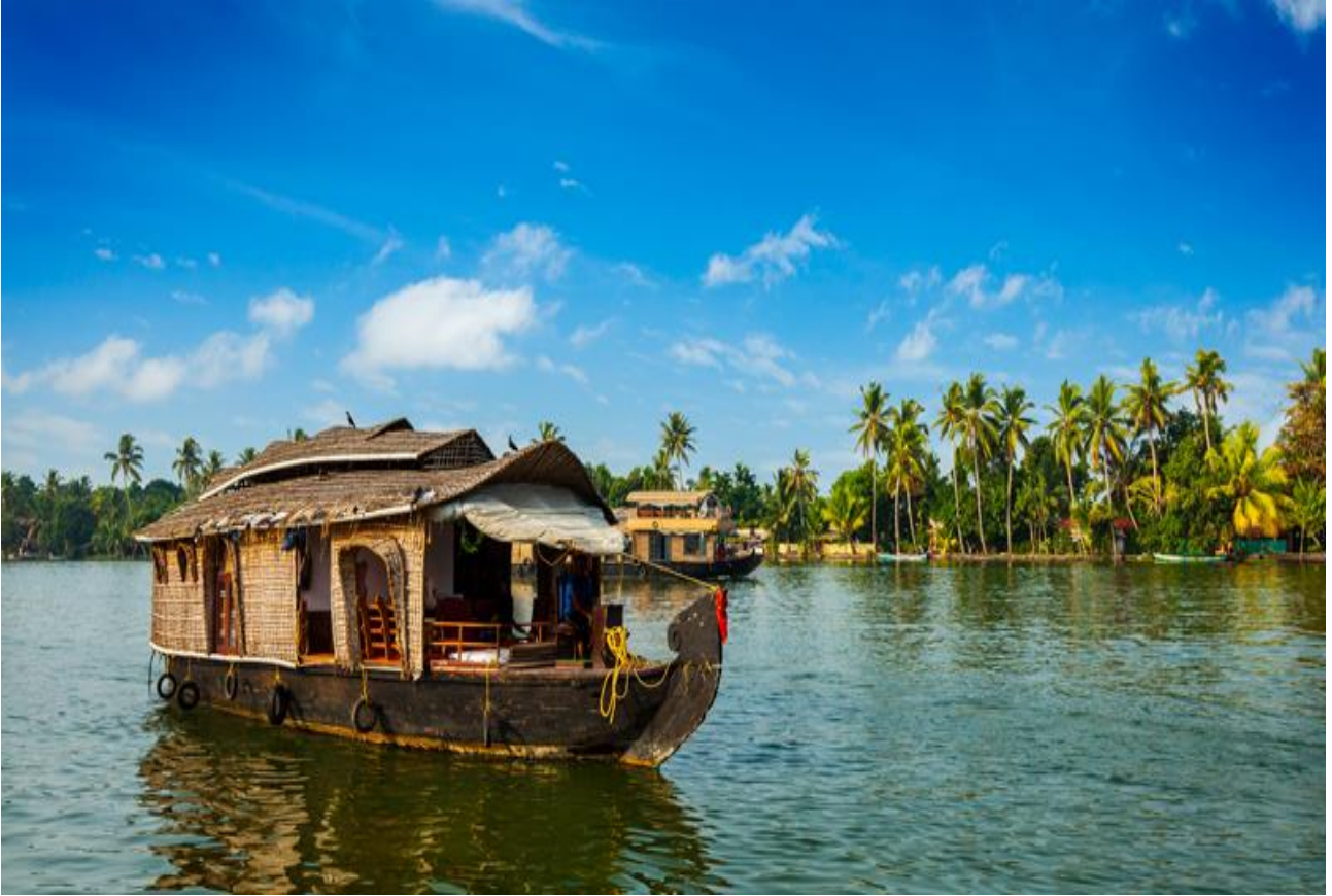
Navigare sui fiumi del Kerala, nell'India meridionale, su una casa galleggiante