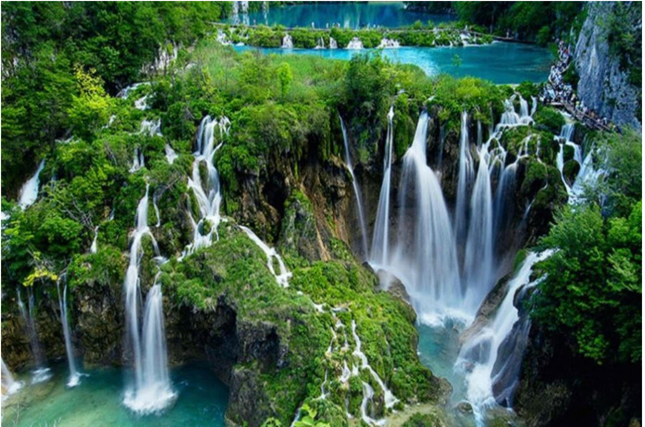
Passeggiare tra i sentieri e le cascate del Parco Nazionale dei Laghi di Plitvice, in Croazia