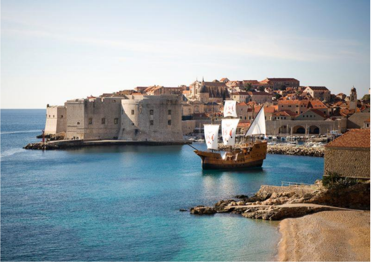
Passeggiare lungo le mura di Dubrovnik