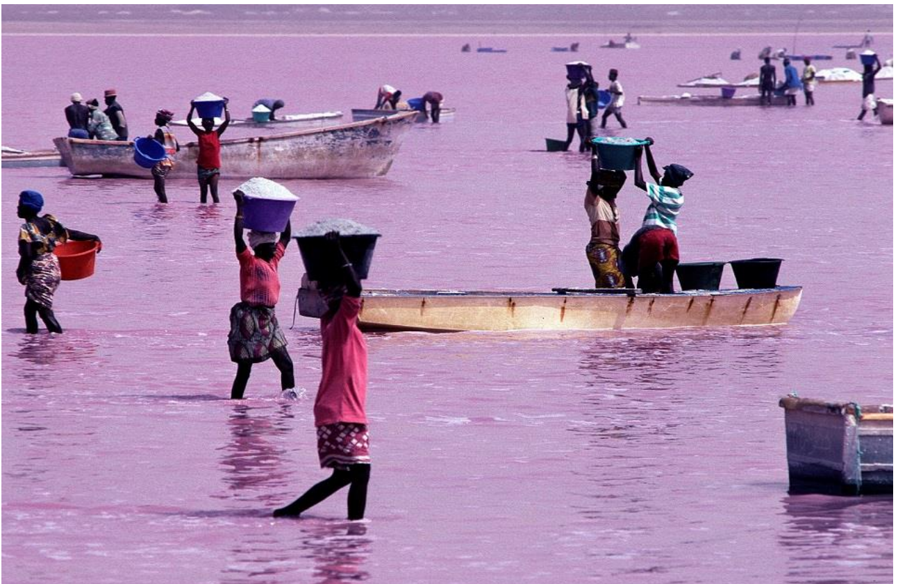
Assistere alla raccolta del sale nel rosato Lago Retba, presso Dakar, in Senegal