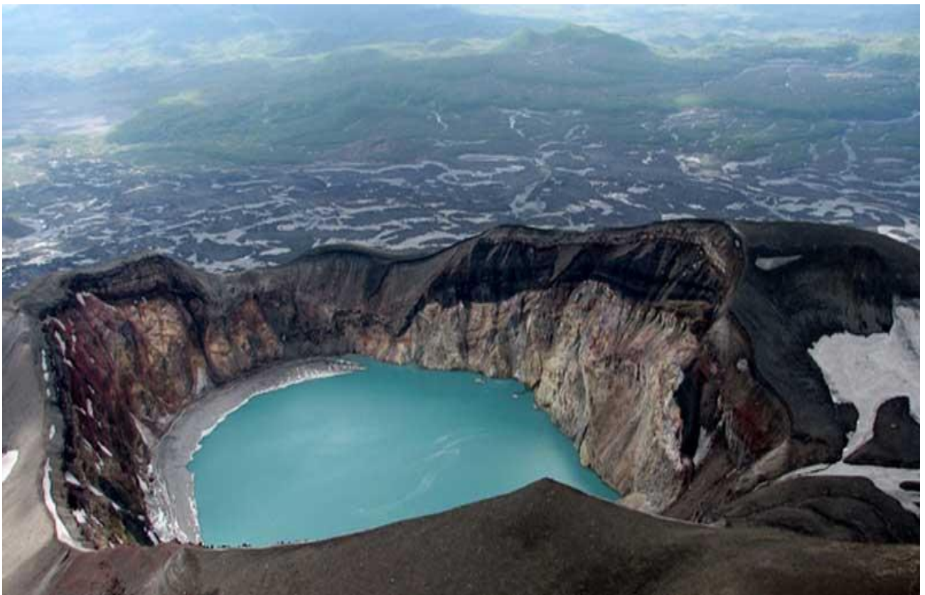
Scoprire i vulcani ghiacciati della Penisola della Kamchatka