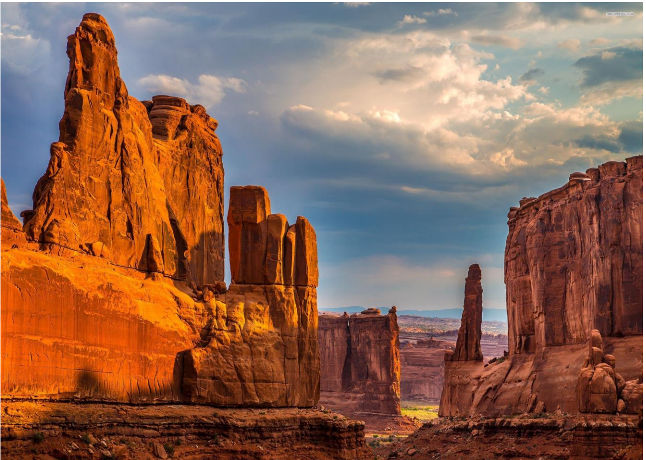
Aspettare l'alba nel Grand Canyon, in Colorado