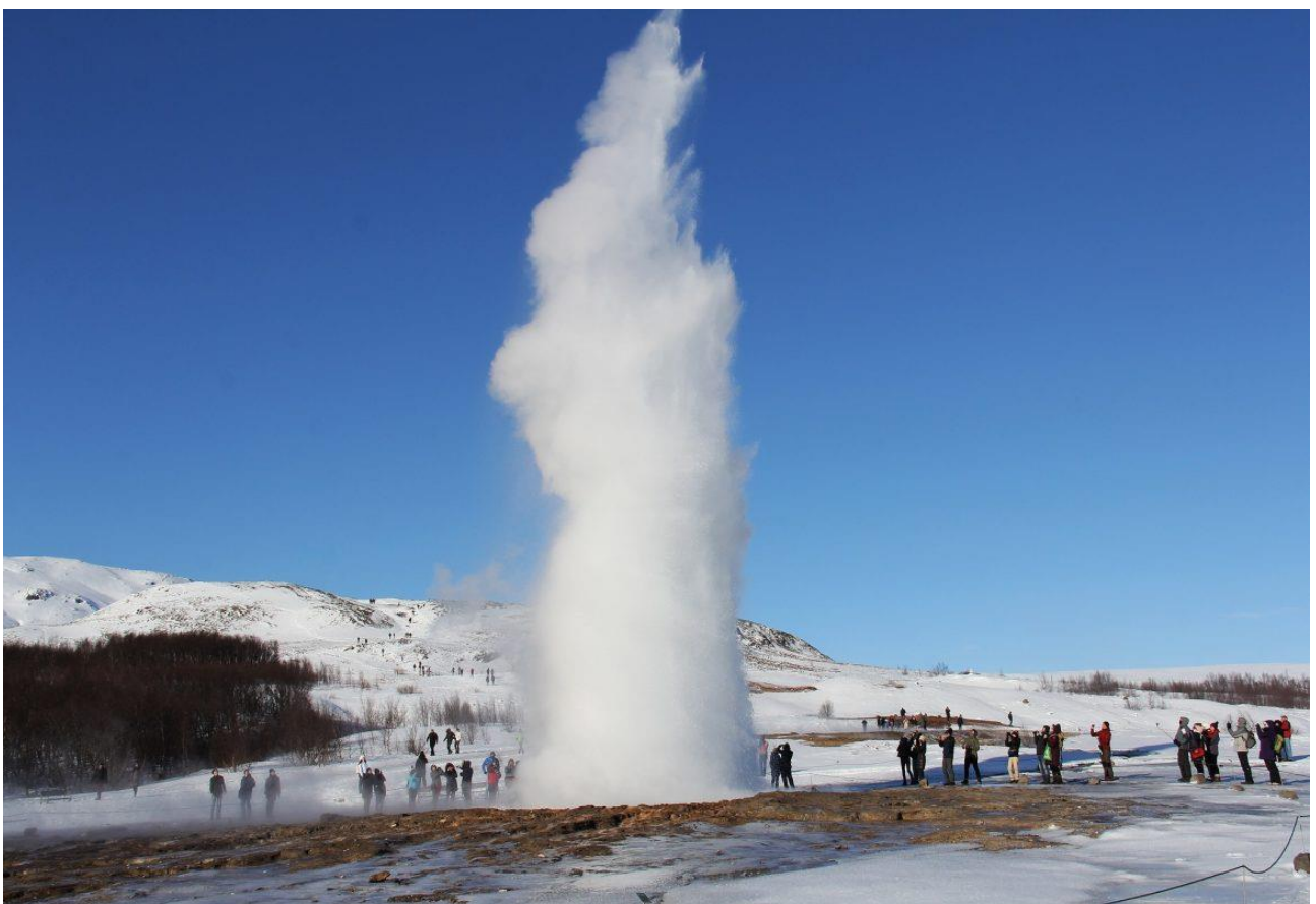
Vedere da vicino l'eruzione di un geyser, in Islanda