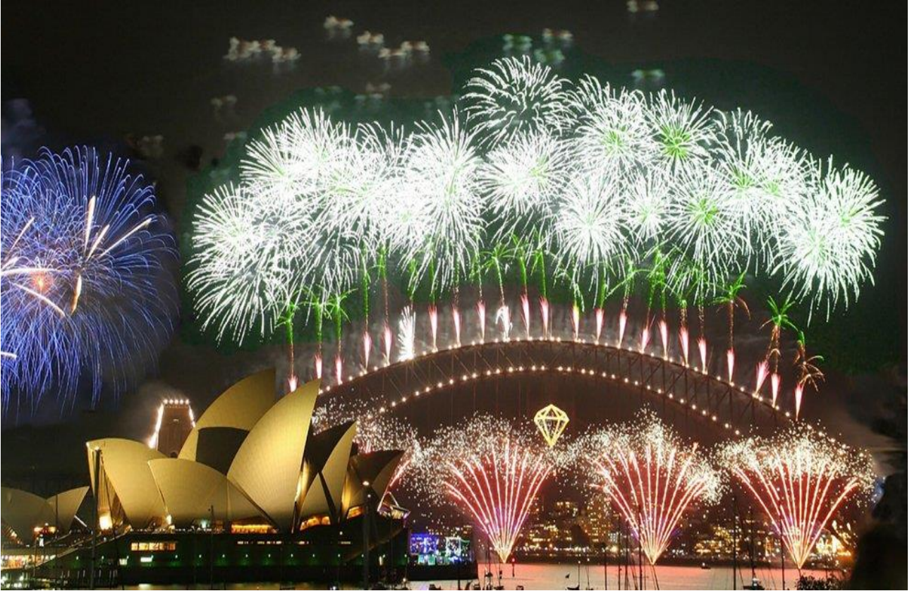
Festeggiare la notte di Capodanno a Sydney, in Australia