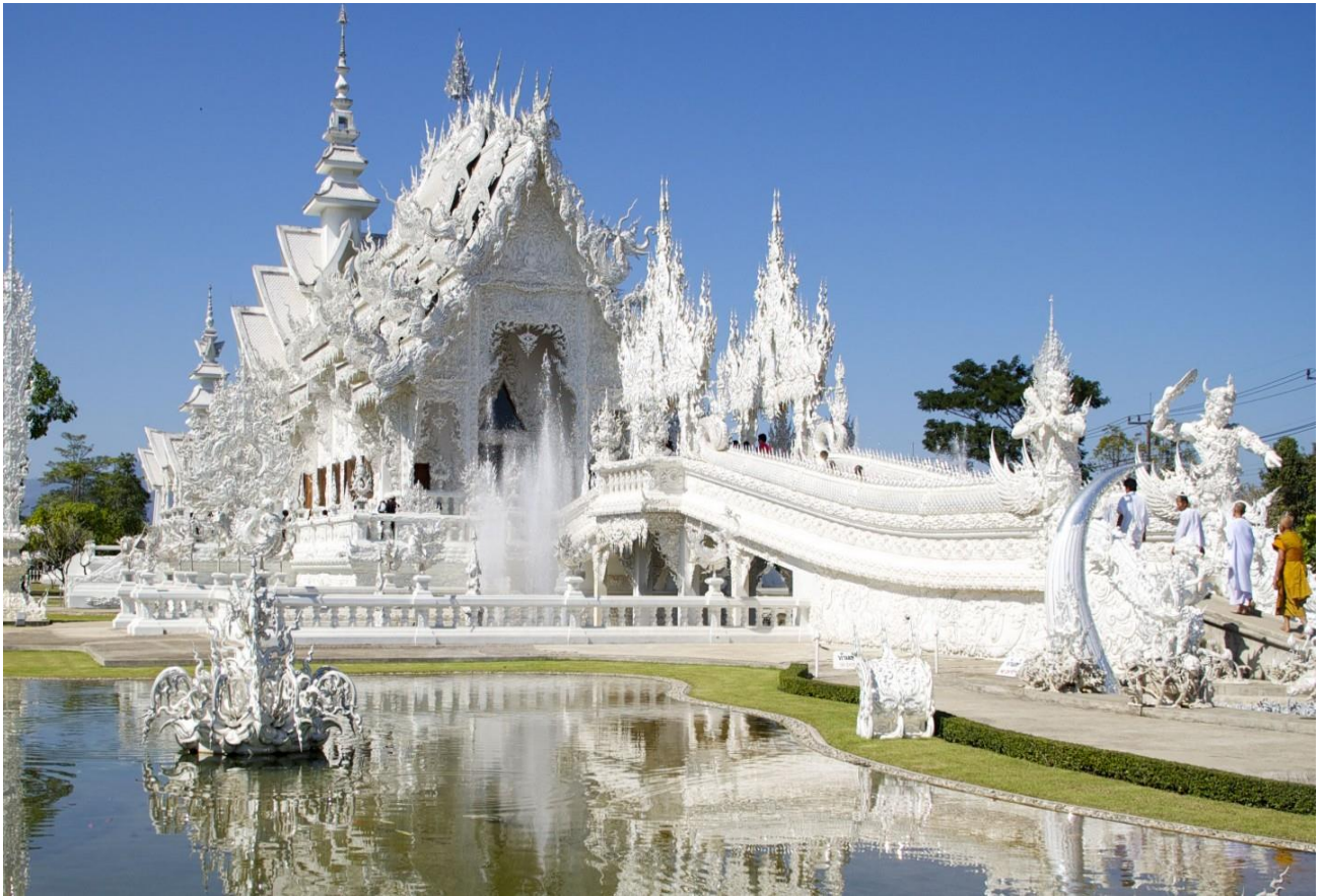
Visitare l'affascinante Wat Rong Khun, il Tempio Bianco di Chiang Rai, in Thailandia