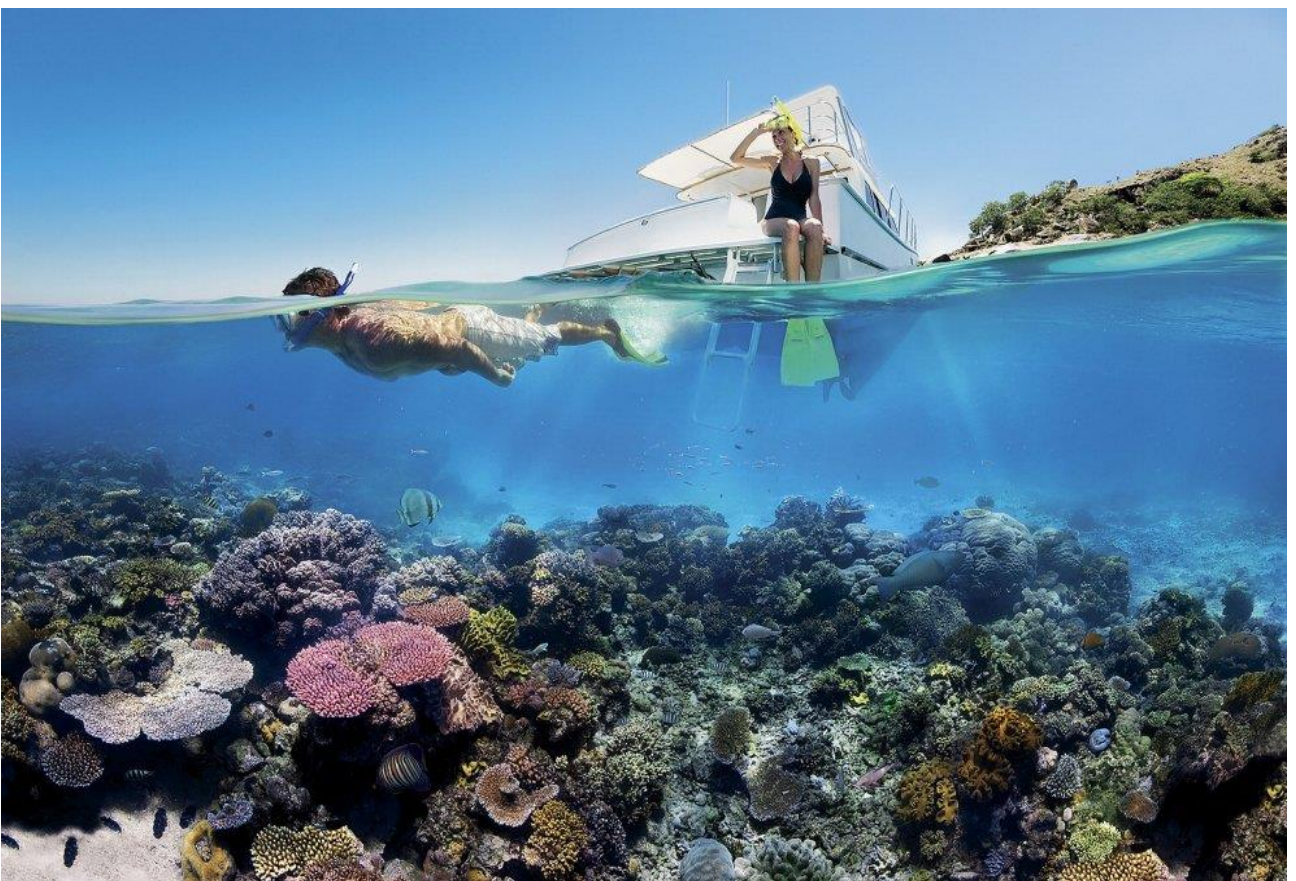
Fare immersioni nella grande barriera corallina australiana