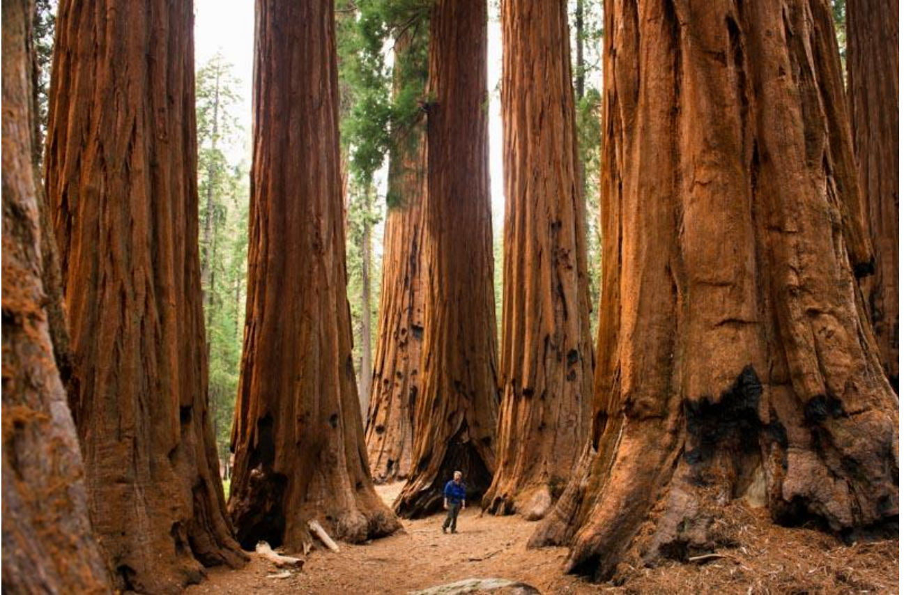
Visitare il Sequoia National Park, in California