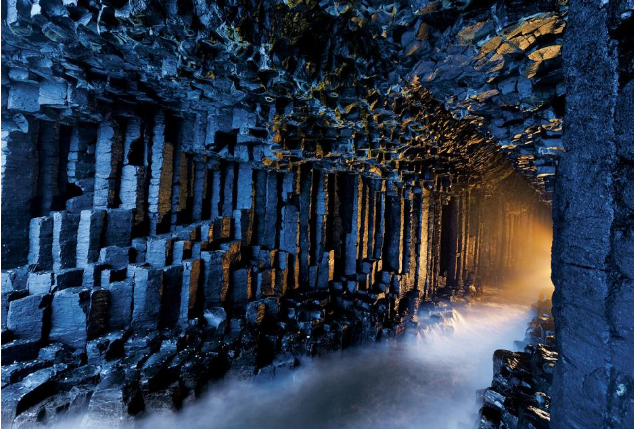
Visitare la Grotta marina di Fingal, sull'Isola di Staffa, nelle Ebridi, in Scozia