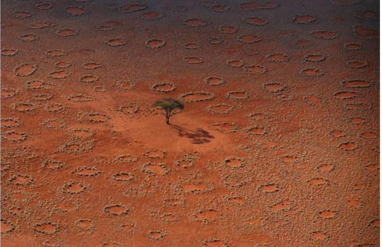
Osservare i misteriosi “cerchi delle fate”, nel deserto della Namibia meridionale