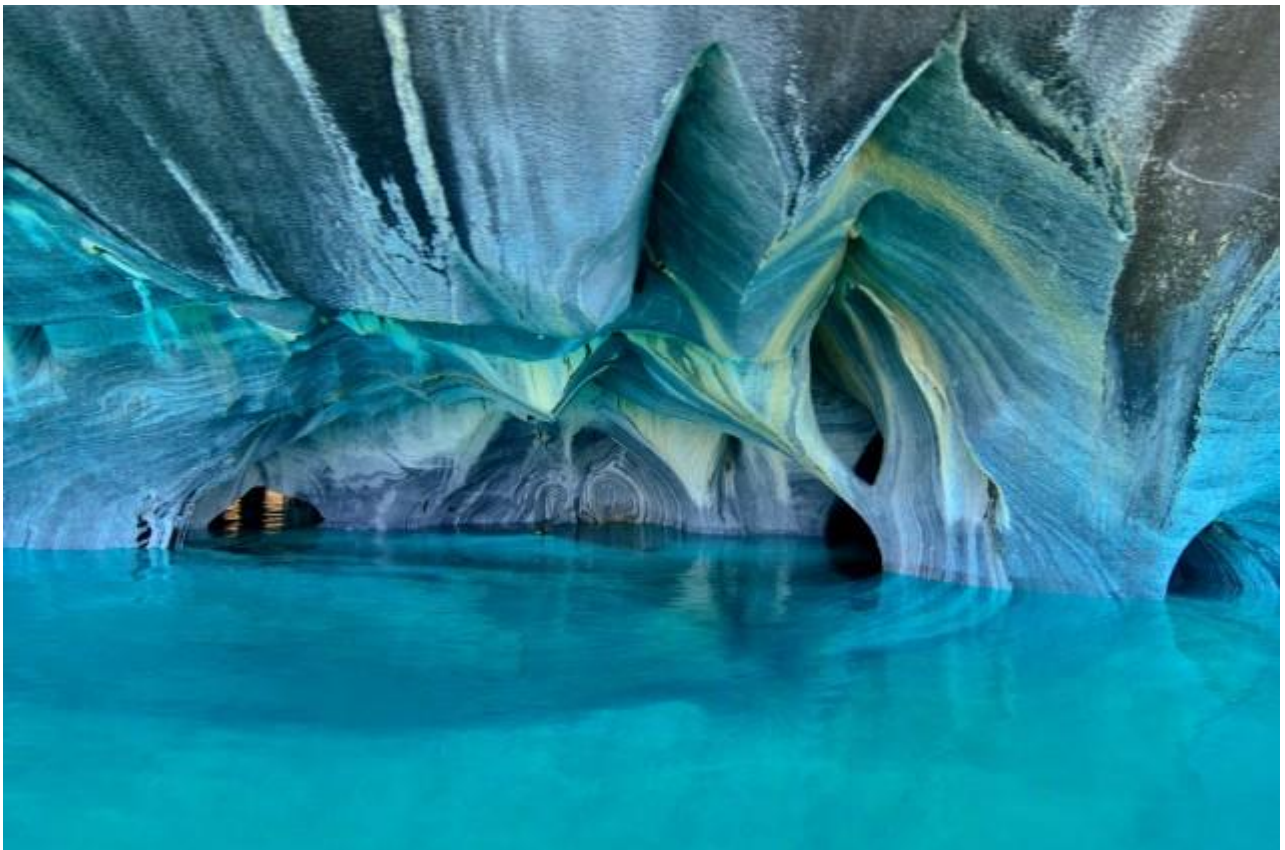
Esplorare la Marble Cathedral, la Cattedrale di Marmo della Patagonia, in Cile