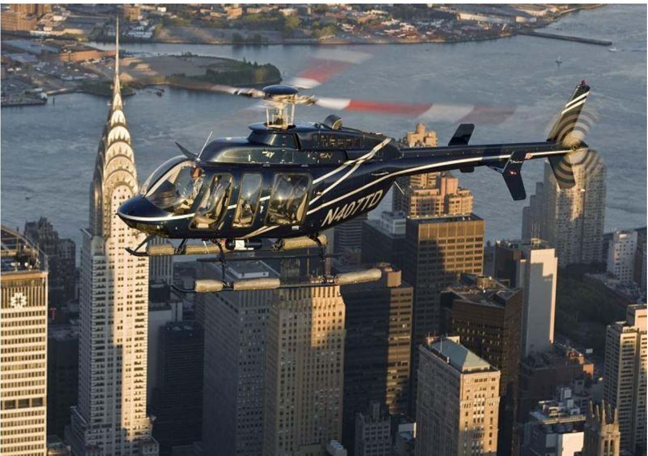
Sorvolare in elicottero i grattacieli di Manhattan a New York