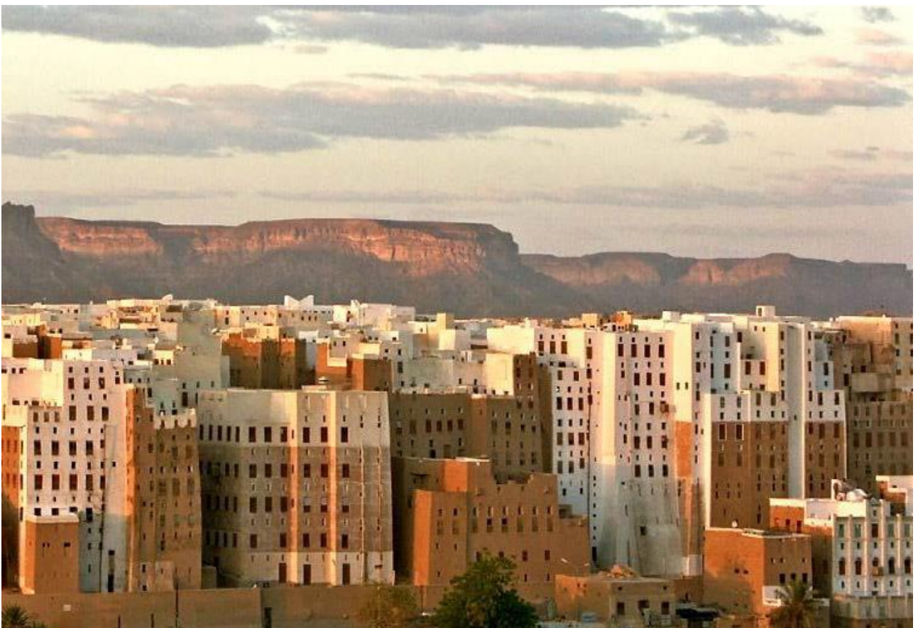
Ammirare le tradizionali case a torre costruite con i mattoni di fango a Sanaa, nello Yemen