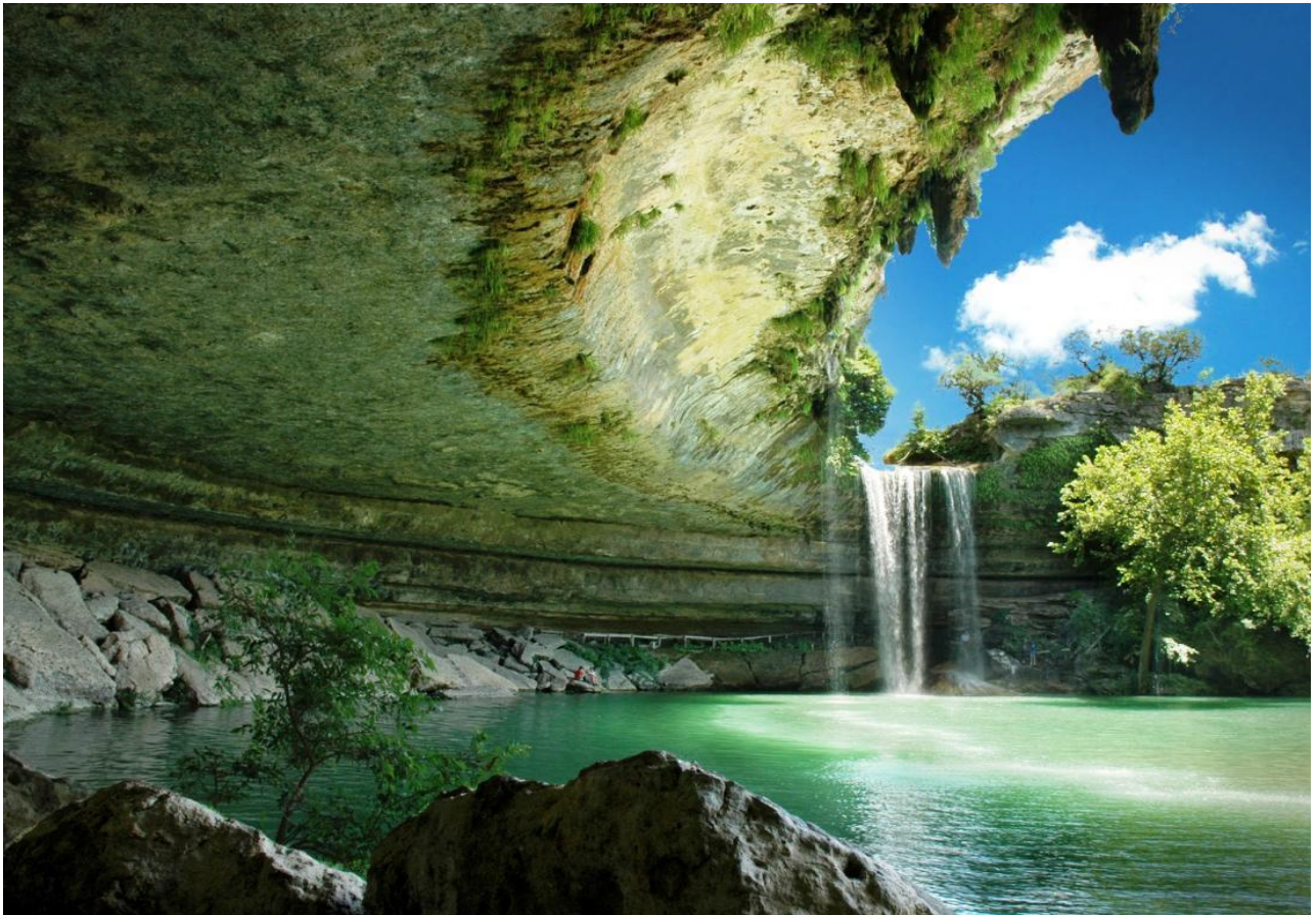
Nuotare nella piscina naturale di Hamilton Pool, presso Austin, in Texas