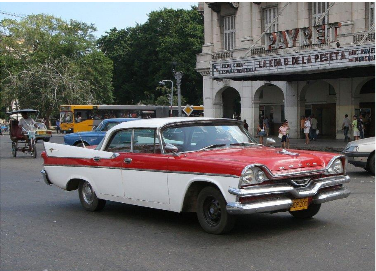
Guidare un'auto d'epoca lungo le strade dell'Havana, a Cuba