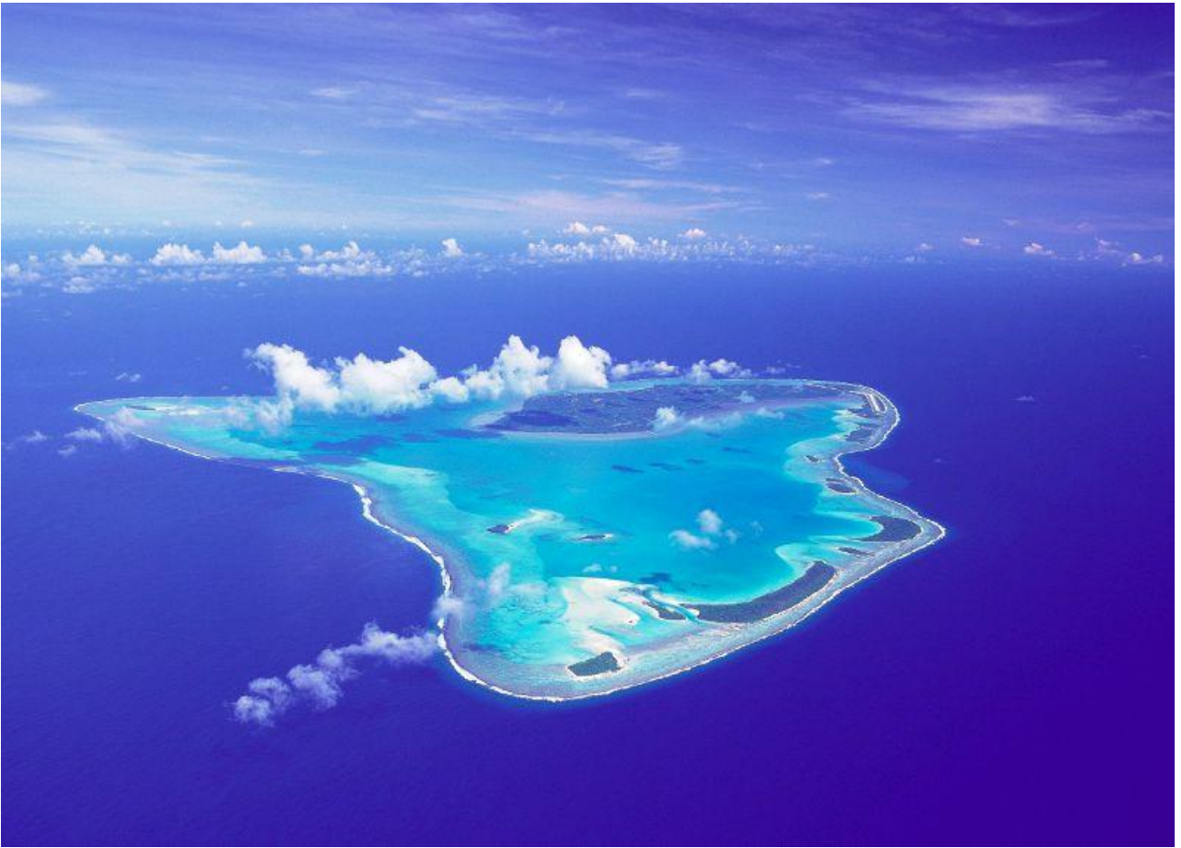
Sorvolare l'Isola di Aitutaki in Nuova Zelanda (20 kmq di terra e 45 di laguna)