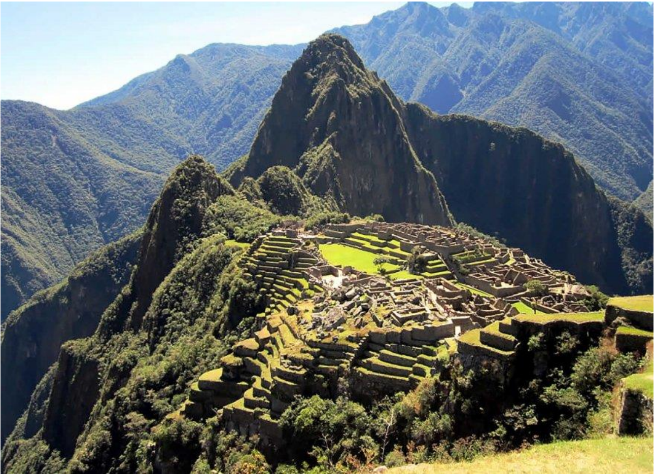
Salire con il Trenino delle Ande sulla cima del Machu Picchu in Perù