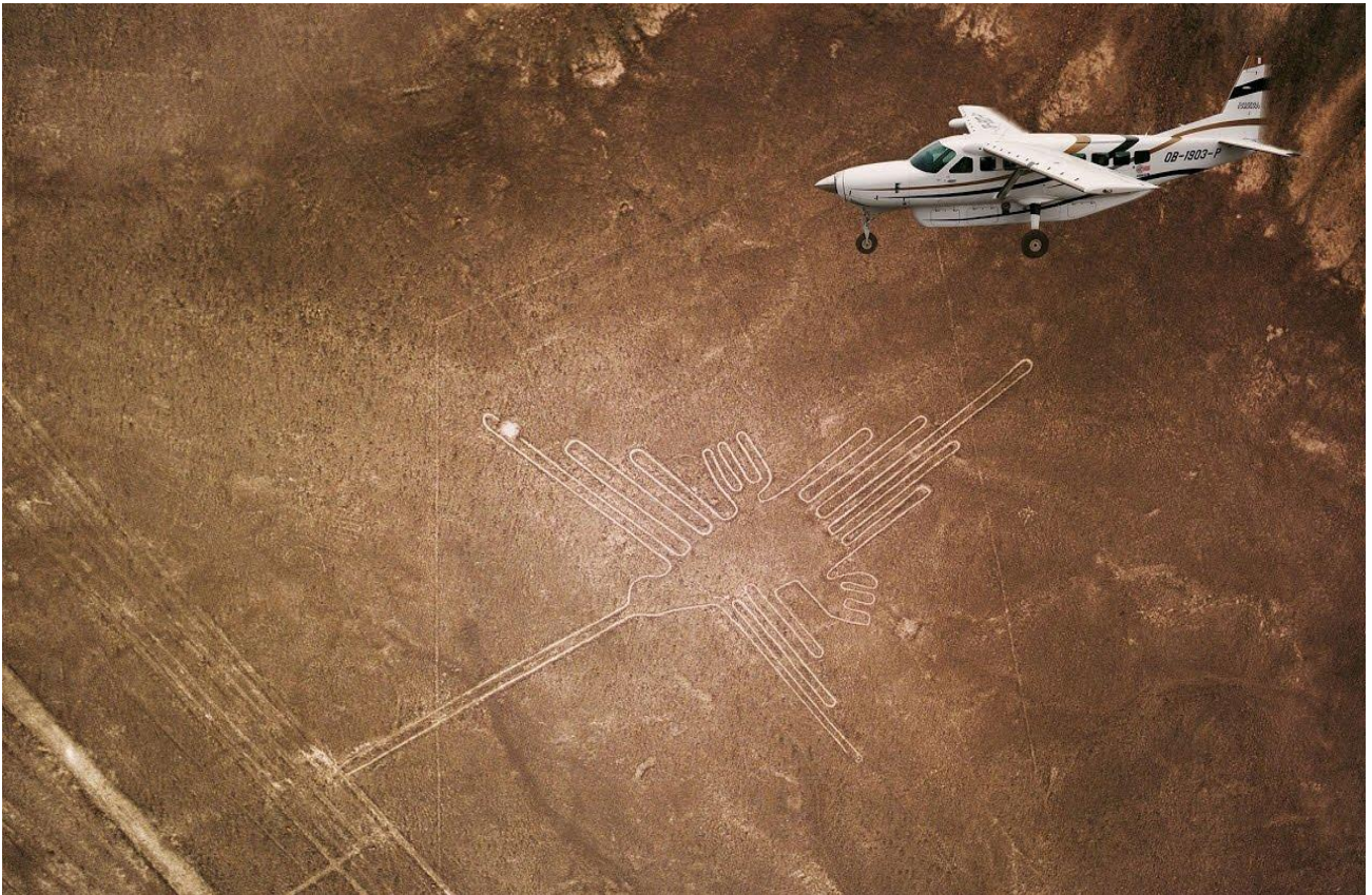
Sorvolare le linee di Nazca, in Perù, a bordo di un piccolo aereo da turismo